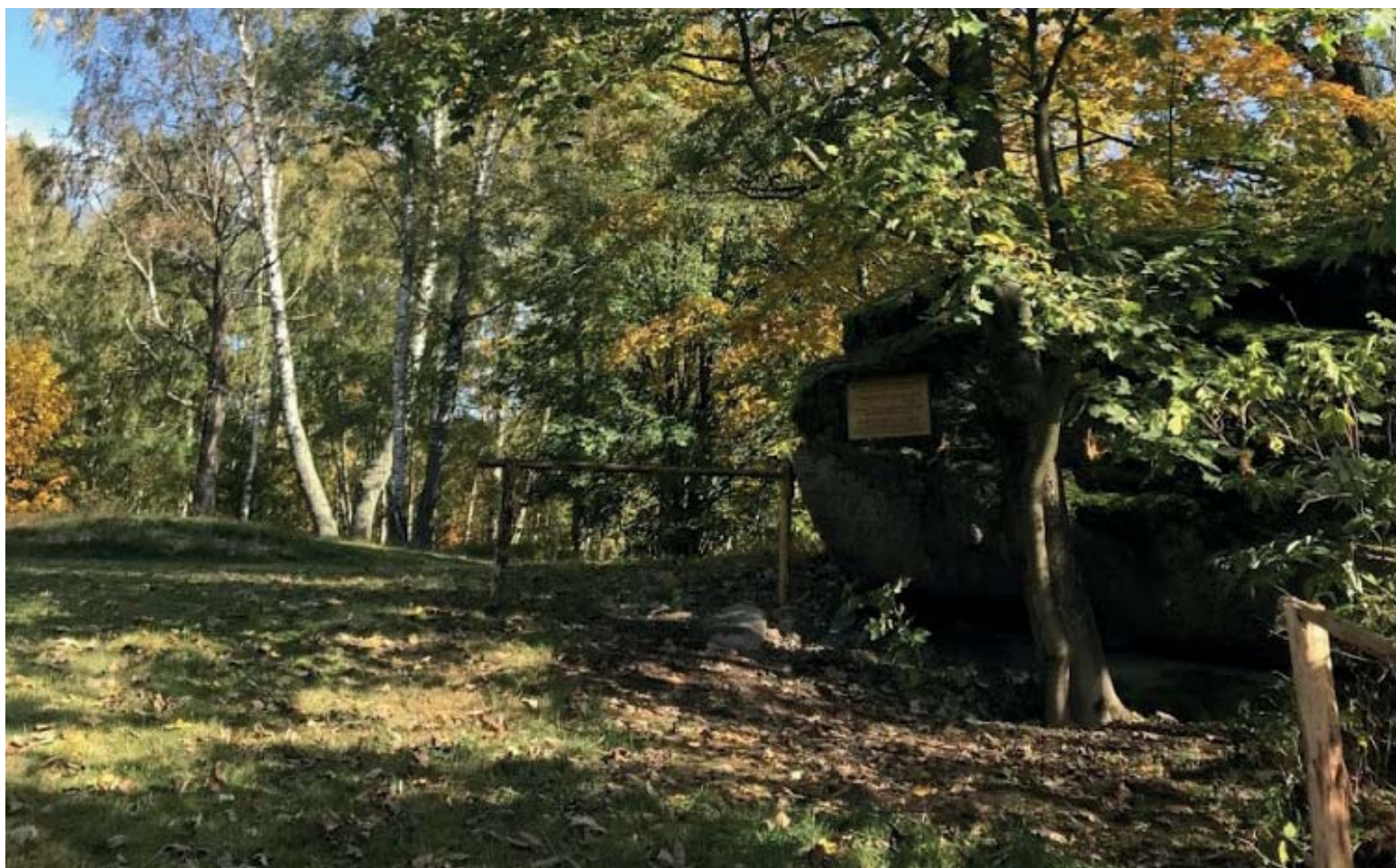
Pamětní deska básníku Friedrichu Schillerovi je na Mariánské Hoře na lépe přístupném místě.