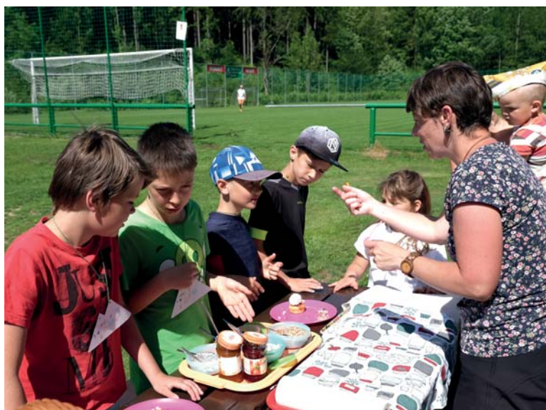
V praktických zkouškách z řemeslných dovedností děti uspěly.

Všem, kteří se na přípravě a zajištění průběhu akce podíleli, velice děkujeme.