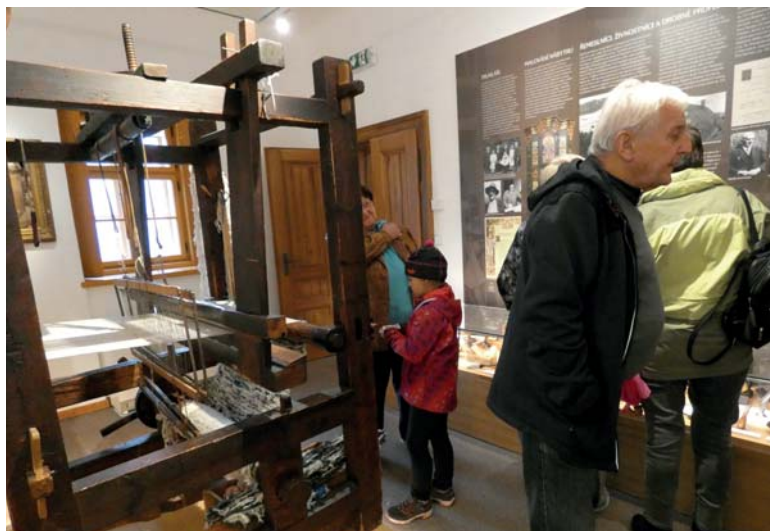
Památník zapadlých vlastenců.