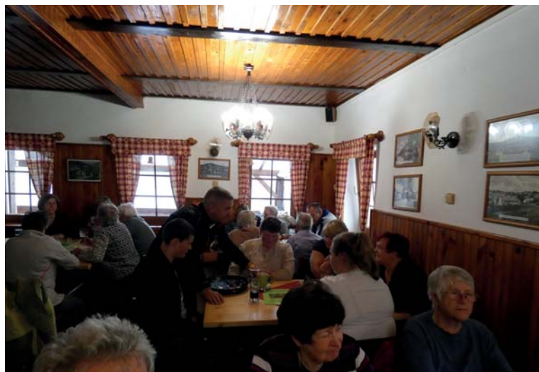
Občerstvení U Zvonku v Kořenově.