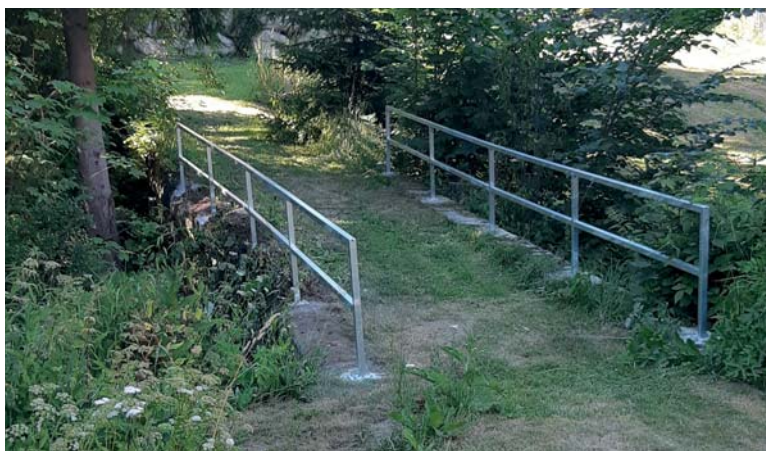
Na lávce přes potok nad poštou bylo instalováno nové zábradlí. Lávka spojuje hlavní silnici s Říhovkou.