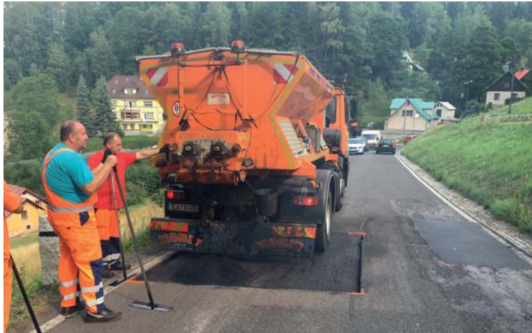
Opravy výtluků na krajské komunikaci.