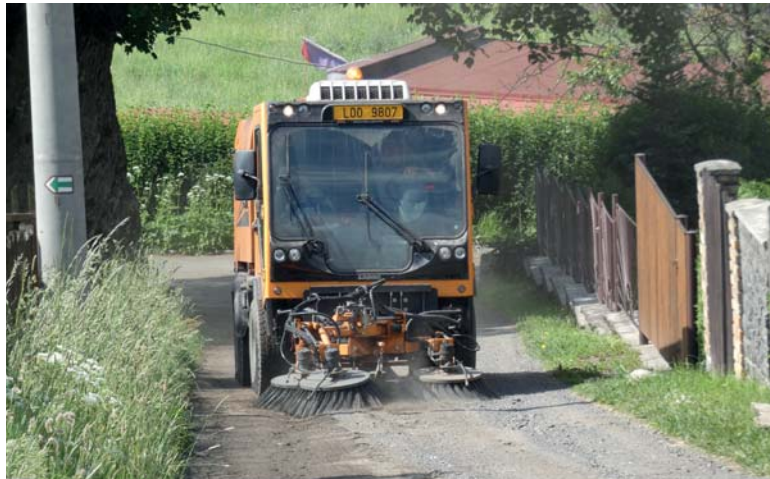
Čištění komunikace u památného stromu.

V jarních měsících probíhal úklid na místních komunikacích i opravy výtluků na hlavní komunikaci.