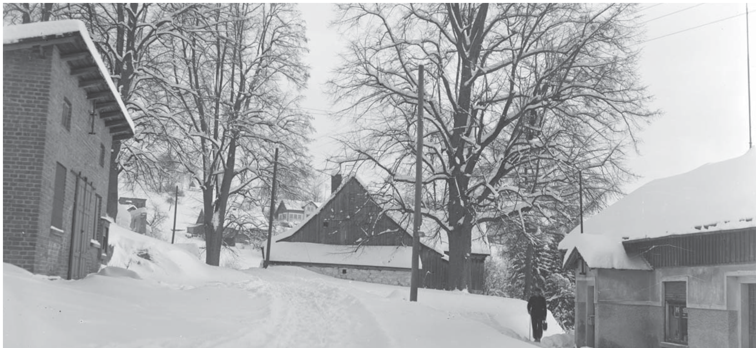
Cesta mezi chalupami na Mariánské Hoře.