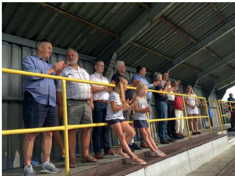
Starostové obcí a měst Albrechtic fanoušci svých týmů.