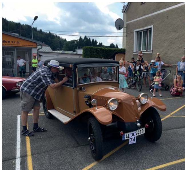
Těsně před startem.