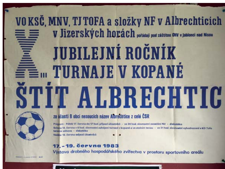
Přehlídka již historických plakátů v klubovně fotbalového klubu.