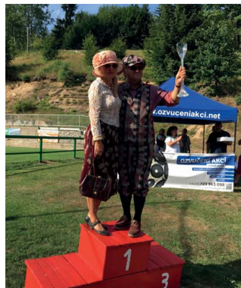
Tradiční cíl a vyhlášení vítězů závodu se koná v našem sportovním areálu