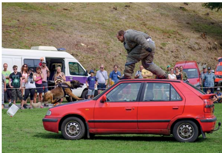
Figurant Věžeňské služby Rýnovice se služebním psem při dynamické ukázce „zadržení“

U Kamenice se v sobotu 24. srpna 2019 utkali dobrovolní hasiči v soutěži O zlatou stříkačku Detoa Albrechtice. Na snímku vpravo jsou v akci domácí hasiči. Vítězství si nakonec odvezli muži z Lučan a ženy ze Zlaté Olešnice. Na tradiční akci se představili rovněž profesionální hasiči z Tanvaldu. Na dvou snímcích ukazují, jak dokáže vodní paprsek rozřezat auto při vyprošťování raněných pasažérů, kteří uvízli v havarovaném voze. Do Albrechtic dorazili také příslušníci Věžeňské služby. Předvedli, jak jejich služební pes dokáže zneškodnit pachatele, což zachycuje další fotografie. Návštěvníci povedené akce ocenili i dobře vychlazené nápoje a bohaté občerstvení.