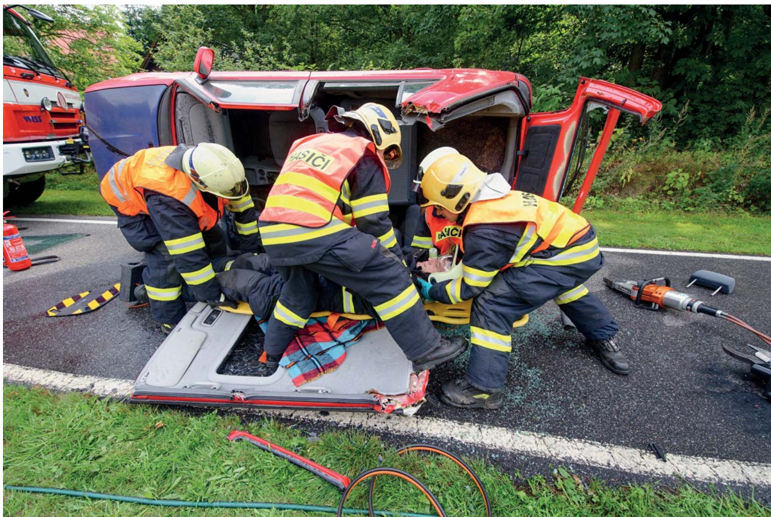
HZS Libereckého kraje při ukázce vyproštění zraněného z havarovaného vozu.