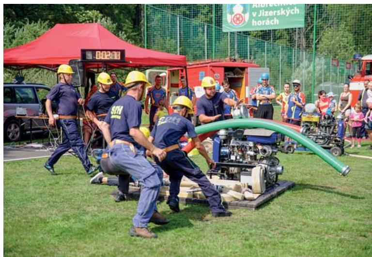
Soutěž družstev dobrovolných hasičů v požárním útoku.