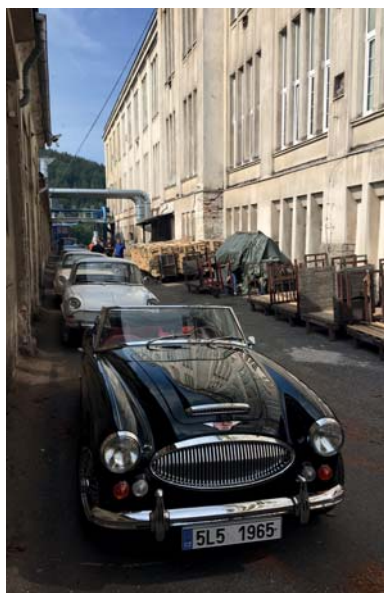
Čekání na start v areálu DETOA.

sportovní areál u Kamenice, kde se konaly jízdy zručnosti a také vyhlášení vítězů letošního klání. Několik stovek fanoušků historických automobilů strávilo v naší obci opravdu pěkné chvíle. Obdivovali nejen autoveterány, ale i dobové kostýmy posádek.