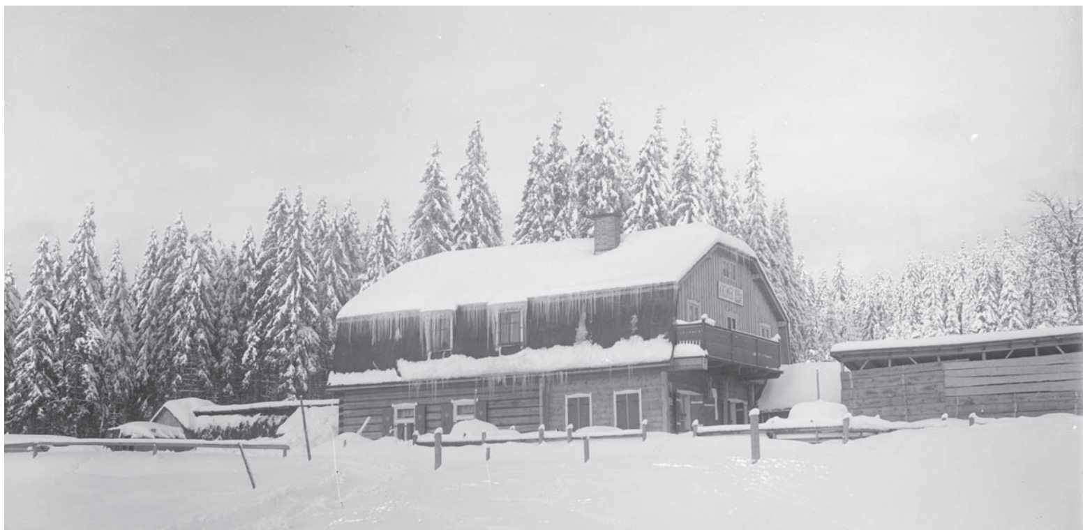
Krömerova bouda u Protržené přehrady.

Kalendář s historickými fotografiemi z obce na rok 2020 je již v prodeji. Cena kalendáře velikost A4 – 100,- Kč, velikost A3 – 200,- Kč.