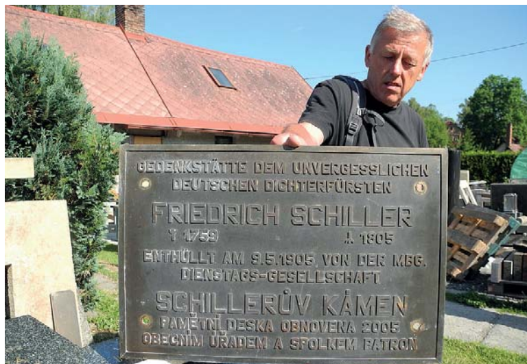
Pamětní deska básníka Friedricha Schillera před úpravou.