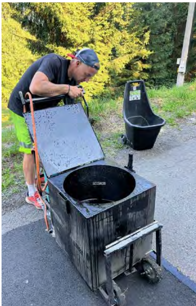
Zalévání spár na Mariánské Hoře.

Po opravách děr a výtluků následovalo „zalévání“ spár firmou STREET Turnov. Bez zálivky spár by po 2-3 letech začaly vznikat velké mezery mezi starým a novým asfaltem a další oprava by byla nezbytná. Letos nám nepřálo štěstí s počasím a plánované opravy musely být posunuty o dva měsíce.