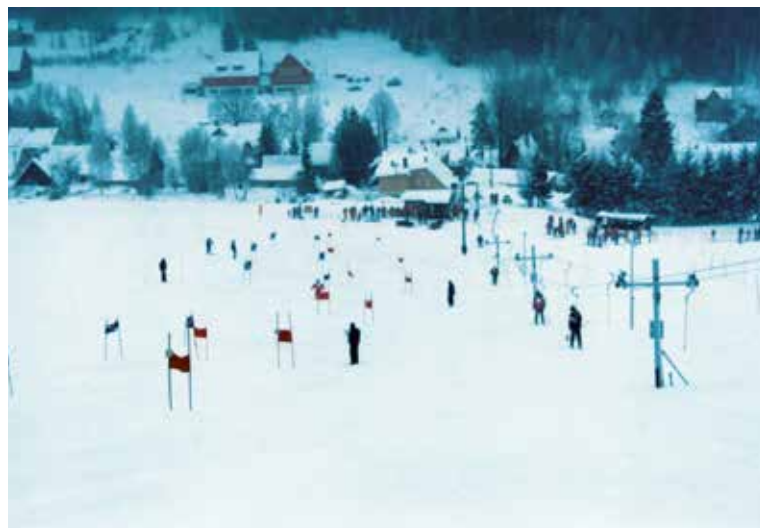
Leden 1995 – Světlý vrch, obří slalom. Závody výrobců hudebních nástrojů z ČR.