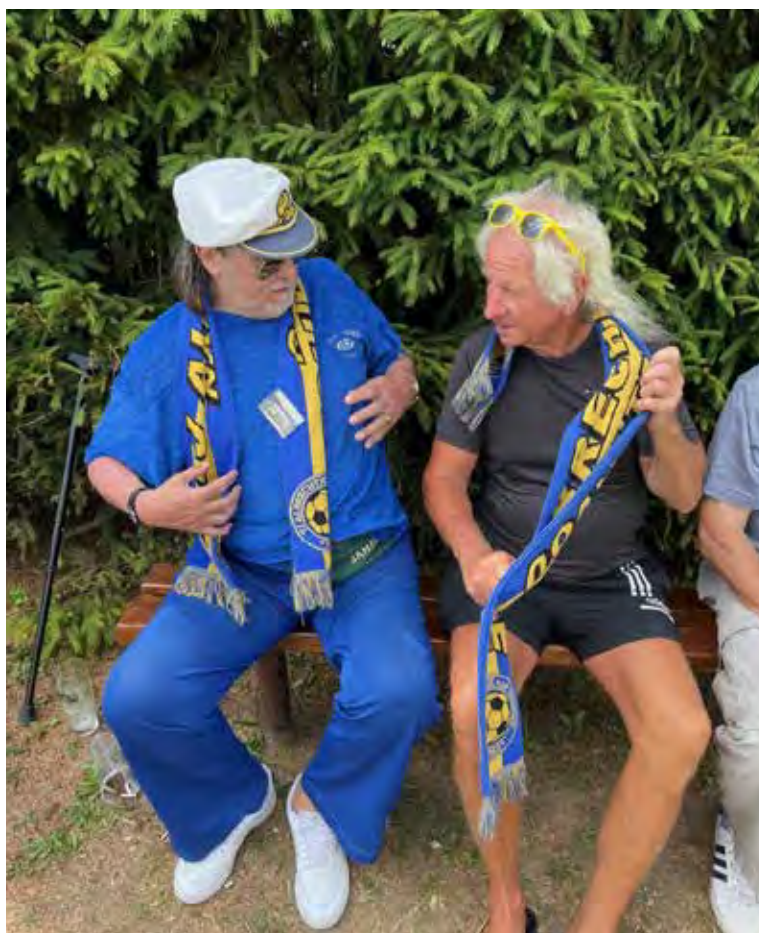
Domácí fanoušci – veteráni měli v „domácích barvách“ sluneční brýle, šály i oblečení.