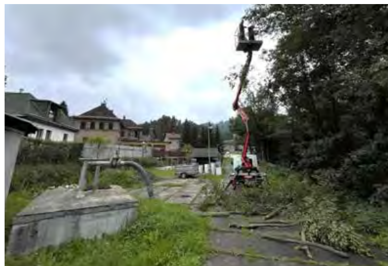
Součástí zabezpečení naší ČOV byl prořez větví, které bránily kamerovému systému v pohledech na kontejnery.