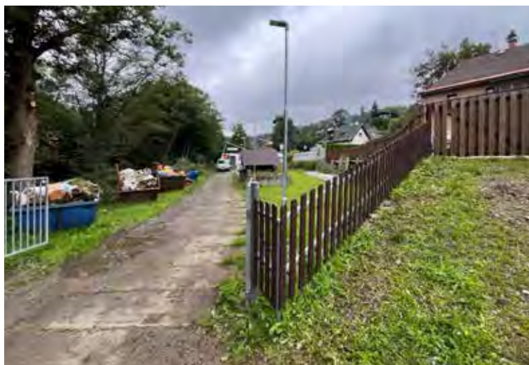
Začátkem srpna byl opraven plot u ČOV. Často se stávalo, že nám cizí lidé přelézali plot a přehrabávali se v odpadech.

Obec se dlouhodobě snaží o maximální hospodárnost při sběru komunálního odpadu a jeho třídění. Bohužel zejména návštěvníci a „chalupáři“ z okolí Albrechtic zneužívají systém, který u nás funguje. Obec se rozhodla instalovat osvětlení a kamerový systém u čistírny odpadních vod (u kontejnerů na odpady). V těchto místech nám různí cizí lidé sváží lednice, sporáky a stavební materiál, což následně finančně zatěžuje obecní pokladnu.