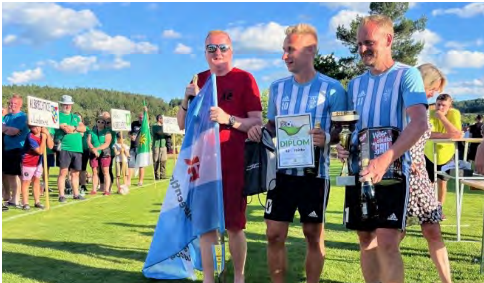
Slavnostní finálový nástup všech mužstev a vítězné trofeje pro naše hráče.

Turnaj se vydařil po všech stránkách a příští setkání v roce 2026 se bude konat v Albrechticích nad Orlicí u Týniště, okres Rychnov nad Kněžnou.