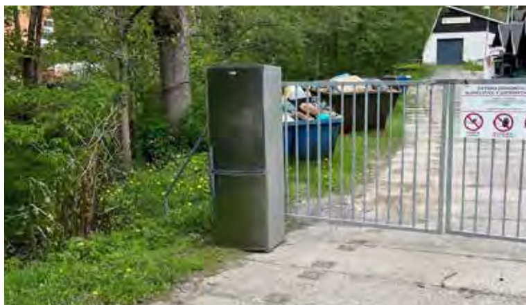
Květen – o víkendu nám „přistála“ před vraty lednice.