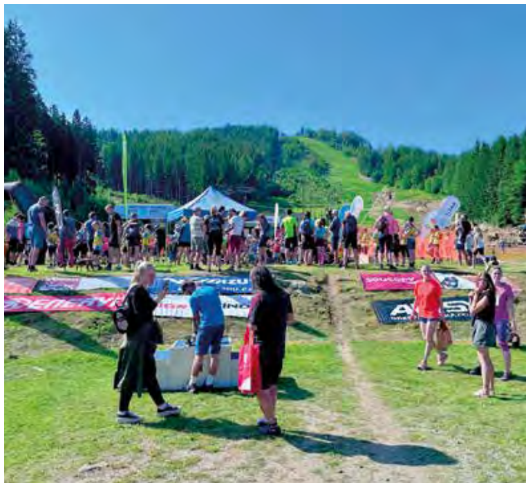
Prostor startu a cíle.