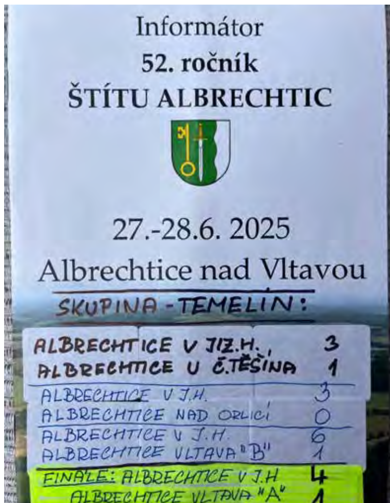
Výsledky našeho mužstva.