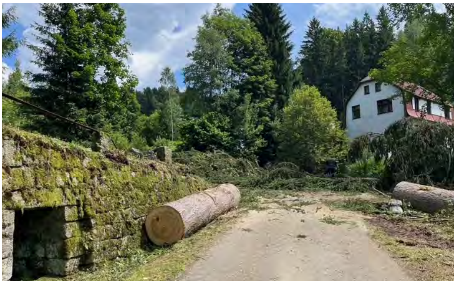
Po vykácení se obnažily krásné stavební prvky vodních děl a také cest, které pochází z dob Rakouska-Uherska.