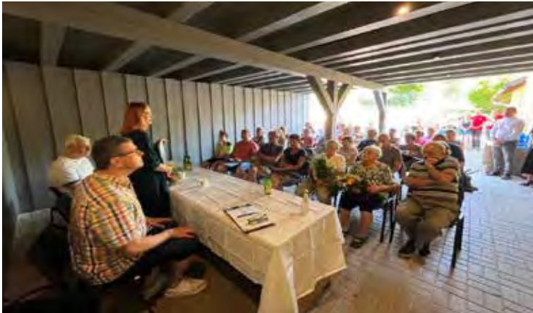
Na akci přišlo v parném počasí více jak 60 občanů a přátel Albrechtic.