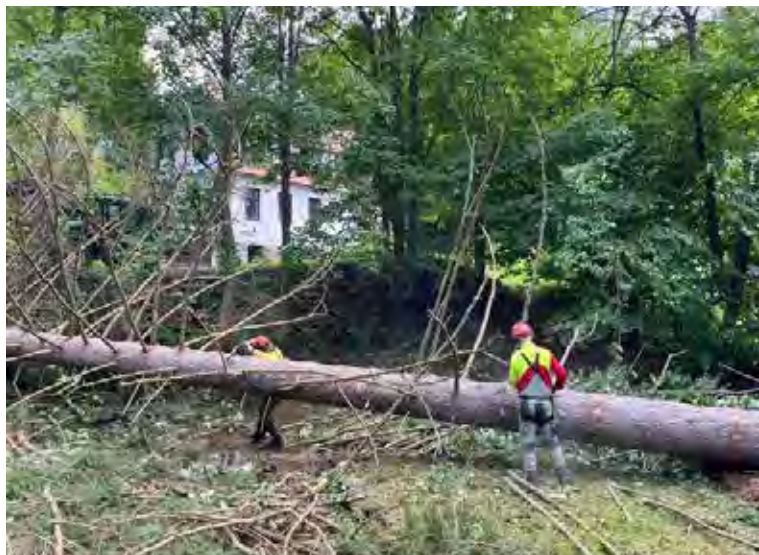
Těžba dřeva v zatáčce u splavu.