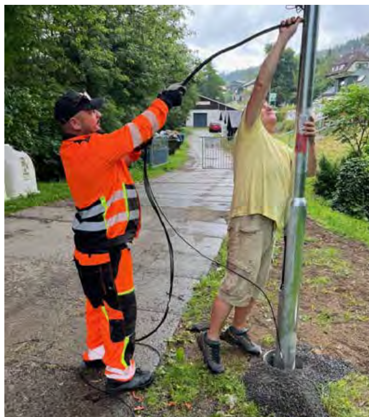
Osvětlení instaloval v červnu Z. Vodička a firma TELMO instalovala kamery.

Obec se dlouhodobě snaží o maximální hospodárnost při sběru komunálního odpadu a jeho třídění. Bohužel zejména návštěvníci a „chalupáři“ z okolí Albrechtic zneužívají systém, který u nás funguje. Obec se rozhodla instalovat osvětlení a kamerový systém u čistírny odpadních vod (u kontejnerů na odpady). V těchto místech nám různí cizí lidé sváží lednice, sporáky a stavební materiál, což následně finančně zatěžuje obecní pokladnu.