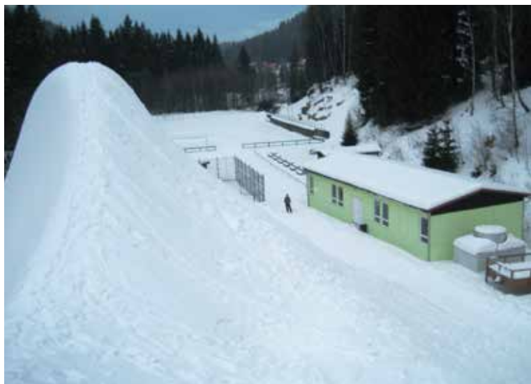
Leden 2009 - zásobárna sněhu pro MS v Liberci v našem sportovním areálu. Výška haldy byla 17 metrů a převyšovala i silnici, která vede na Josefův Důl.