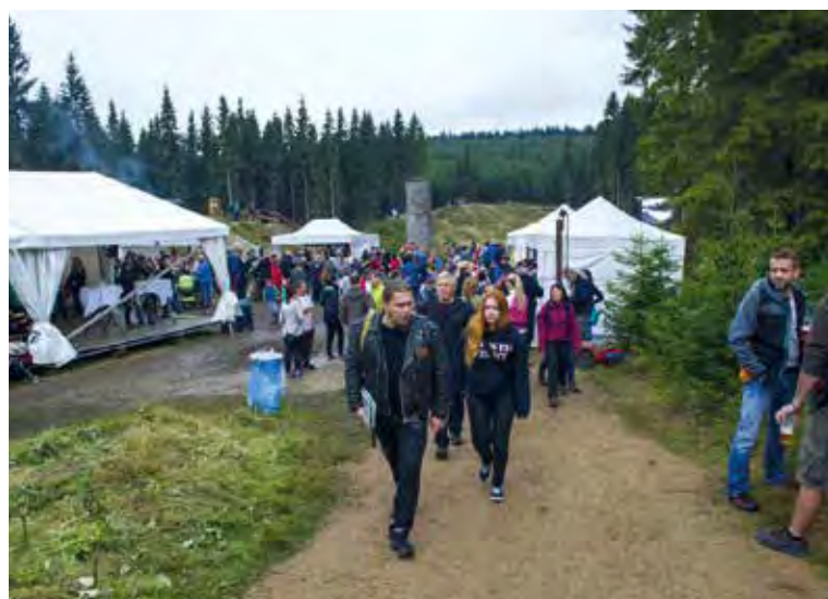
100. výročí od tragické události na Protržené přehradě. Září 2016.