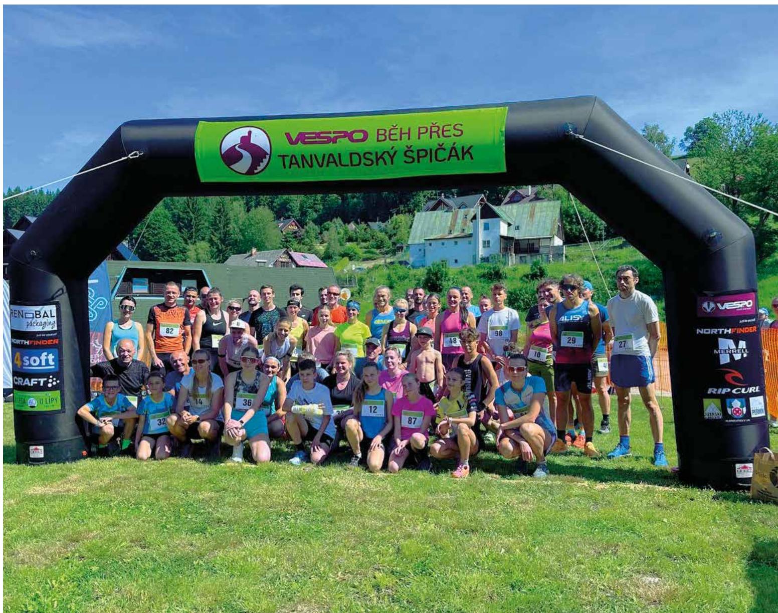
Účastníci hlavního závodu.