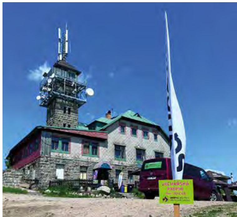
Vrchářská přeměna na Tanvaldském Špičáku.