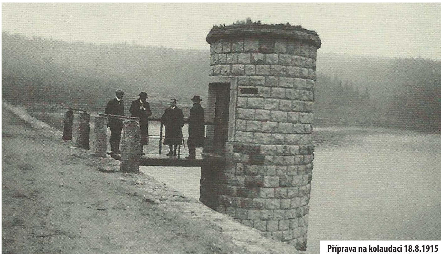
Příprava na kolaudaci 18.8.1915

Jedny z posledních snímků napouštění přehrady na Bílé Desné. Její kapacita měla činit 400 tis. m 3 vody, v době neštěstí byla přehrada napuštěna zhruba ze \frac{3}{4} , to znamená, že v ní bylo přibližně 290 tis. m 3 . Na snímku jsou členové Vodního družstva pro stavbu přehrady na Desné.