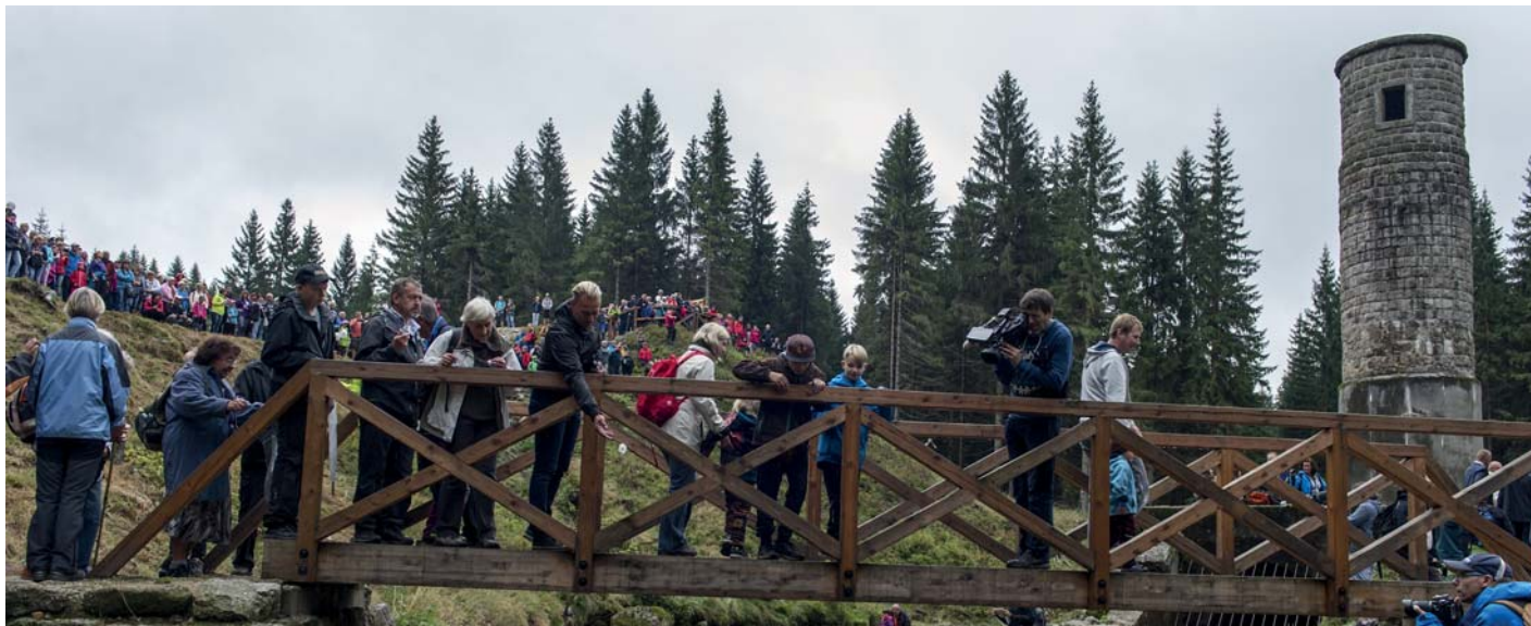
Z lávky nad potokem bylo do vody vhozeno 67 bílých květů, které počtem symbolizovaly počet obětí.