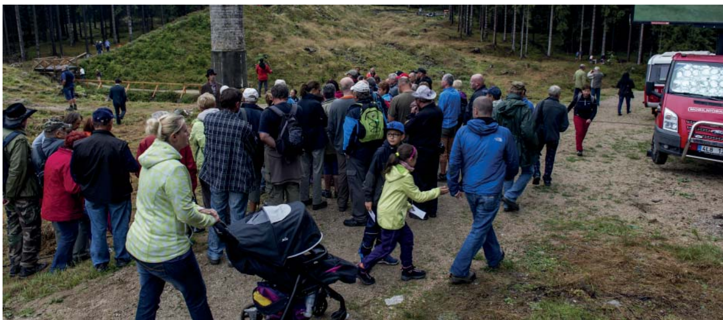
Návštěvníci míří k pomníku obětem, kde proběhne bohoslužba slova a vysvěcení pomníku.