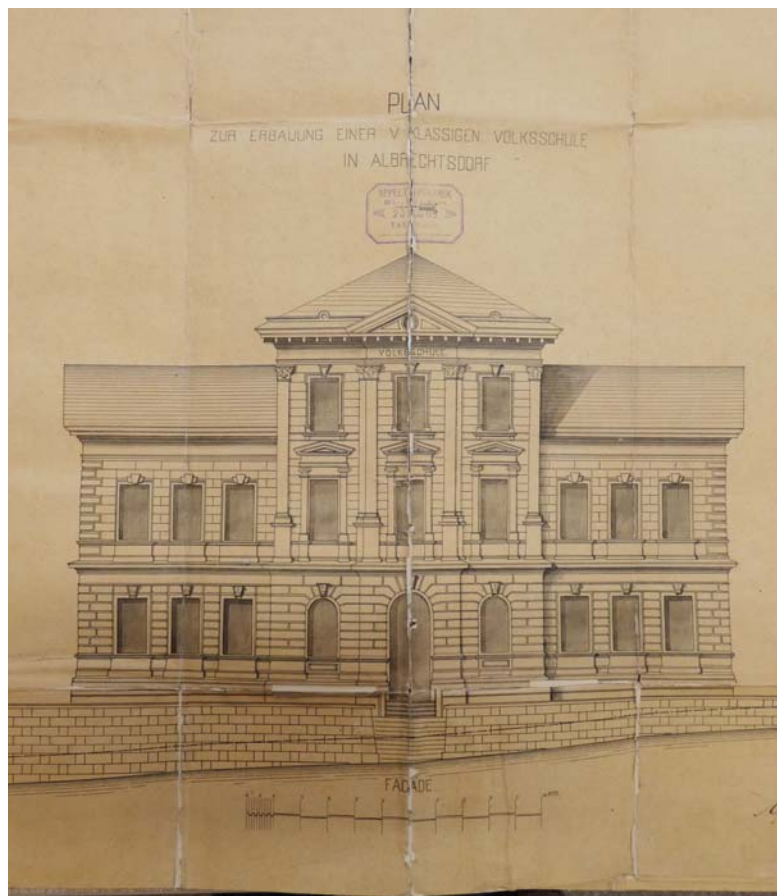
Plány na školu v Albrechticích z roku 1885 z firmy APPELT & PEKAREK Tannvald.