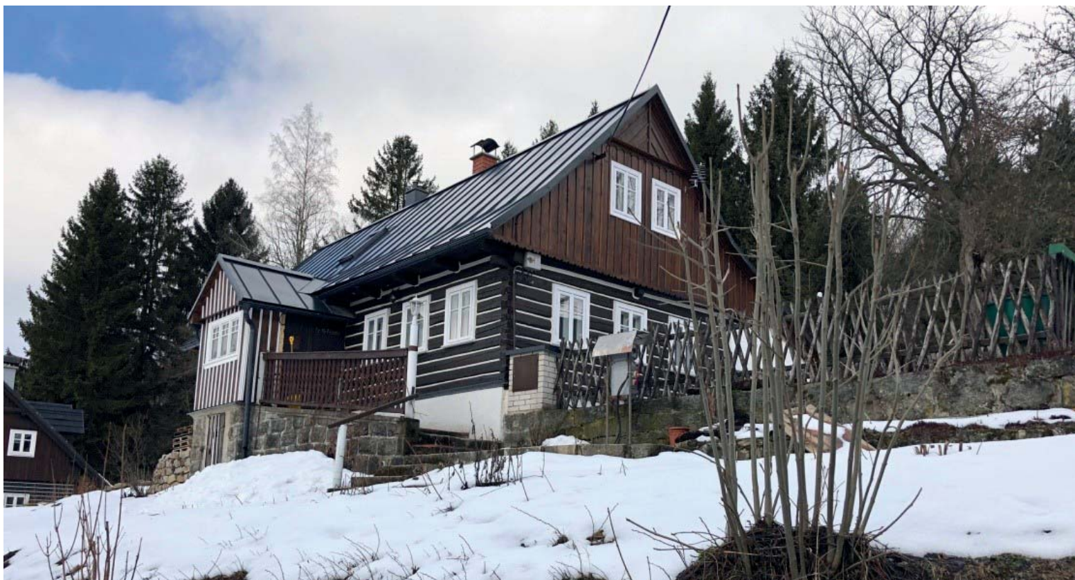
chalupa na Mariánské Hoře, kde bydlel Adolf Pörner.

Autor: V. Mikolášek, Jablonecké Paseky, časopis Cesta míru 17. dubna 1958. Článek připravil: Jan Tlapák