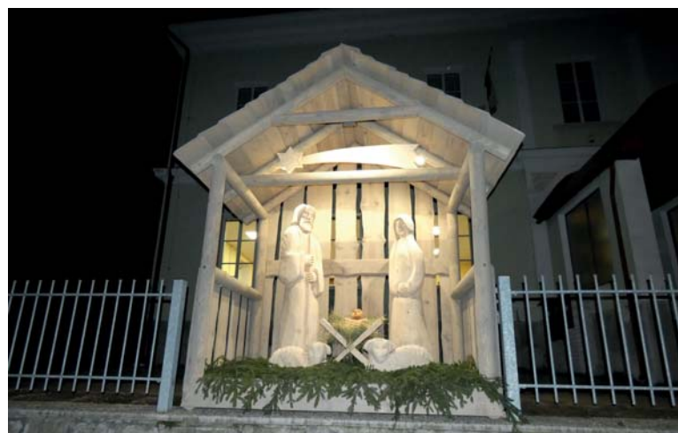
Konečný výsledek včetně osvětlení, které zajistil elektrikář Z. Vodička z Albrechtic.