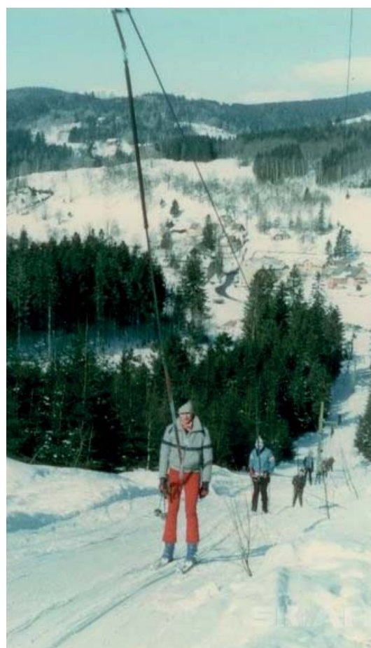
Tatrapoma okolo roku 1985 z Albrechtic na Špičák.