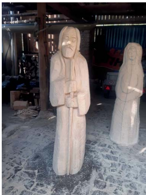
24. října 2019 – socha Josefa a Marie v dílně v Českém ráji.