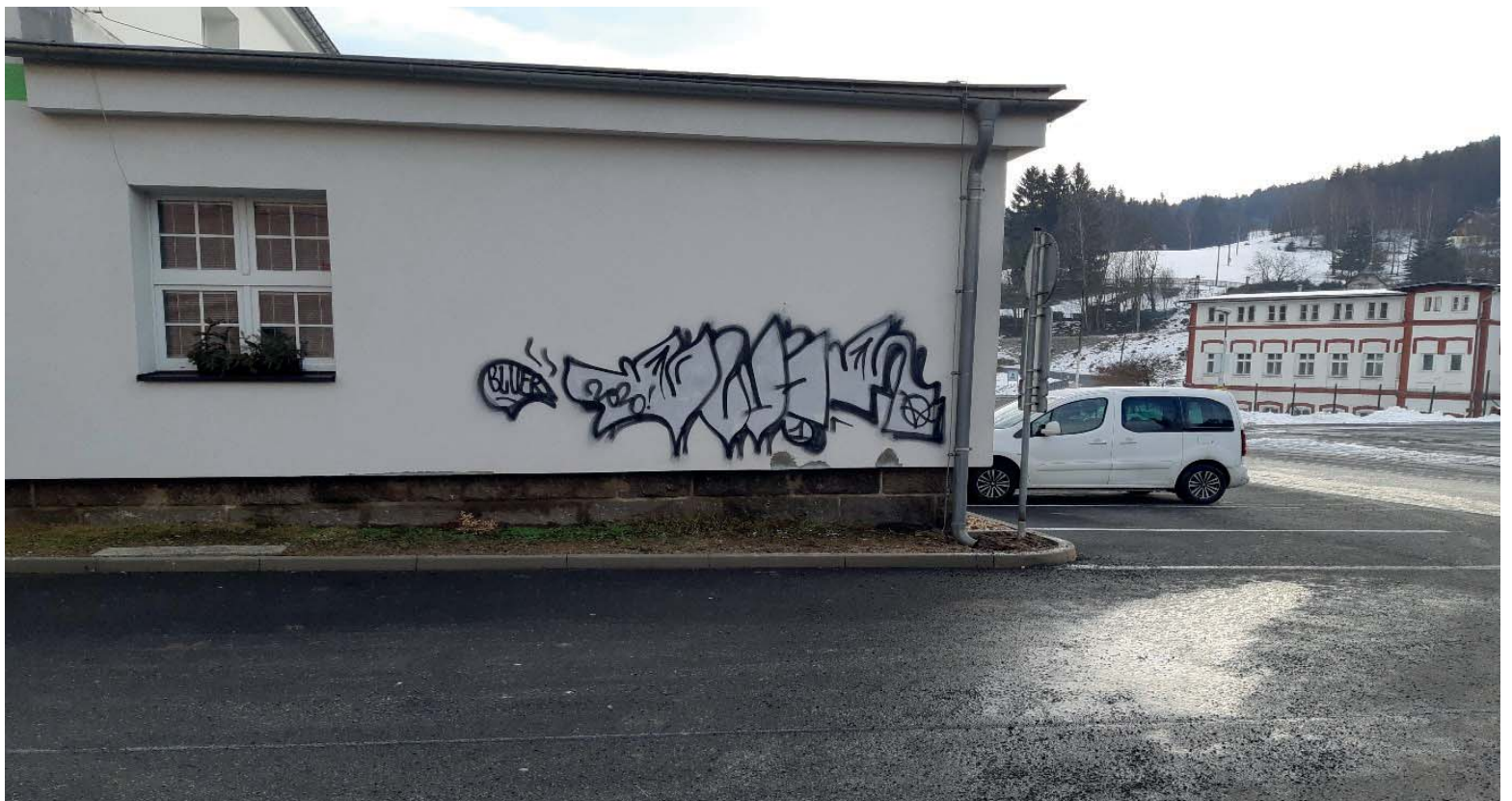
Sprejerství Jiřetín pod Bukovou.

Dne 14. 1. 2020 neznámý pachatel odeslal na Obecní úřad Albrechtice v Jizerských horách email se souborem, který byl vydáván za fakturu se znakem Finanční správy v záhlaví. Po otevření souboru antivirový program NOD od ESET oznámil, že byla detekována chyba, ale že se programem podařilo opravit. Tato hláška se opakovala a následně IT technik obecního úřadu Al-