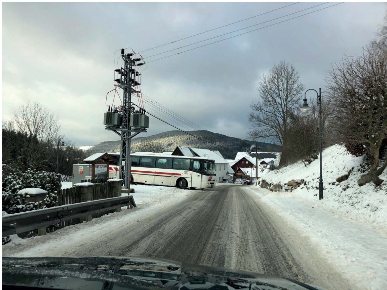
Složitá dopravní situace trápila o Vánocích 2019 obyvatele Albrechtic. „Zvláštní“ parkování autobusu na travnaté ploše u chaty Julie.