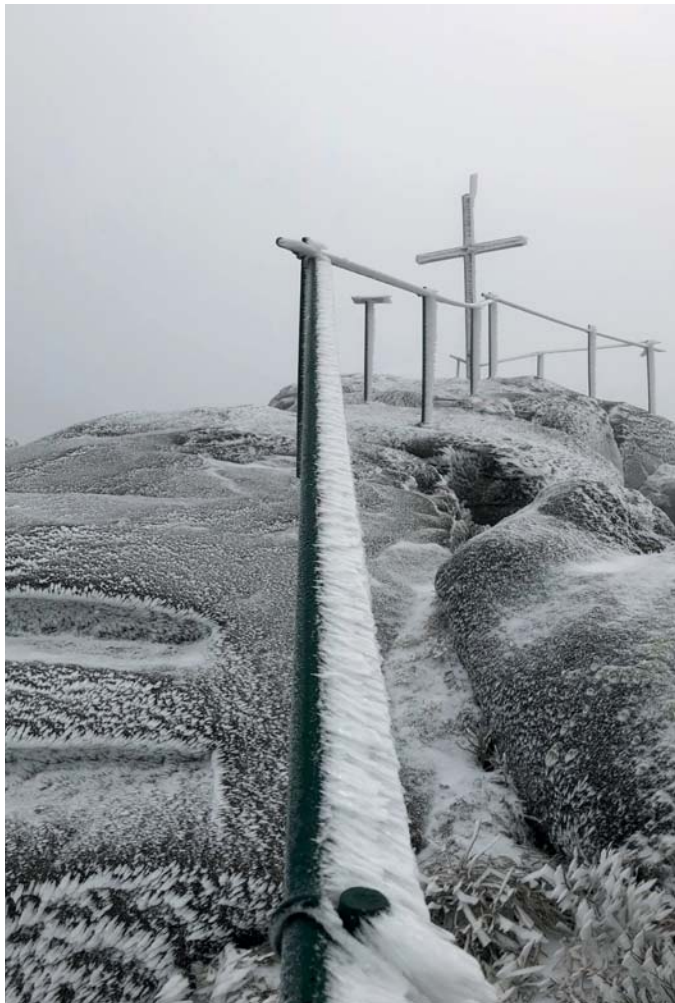
Štědrý den 2019 na Jizeře (1122 m n.n.).