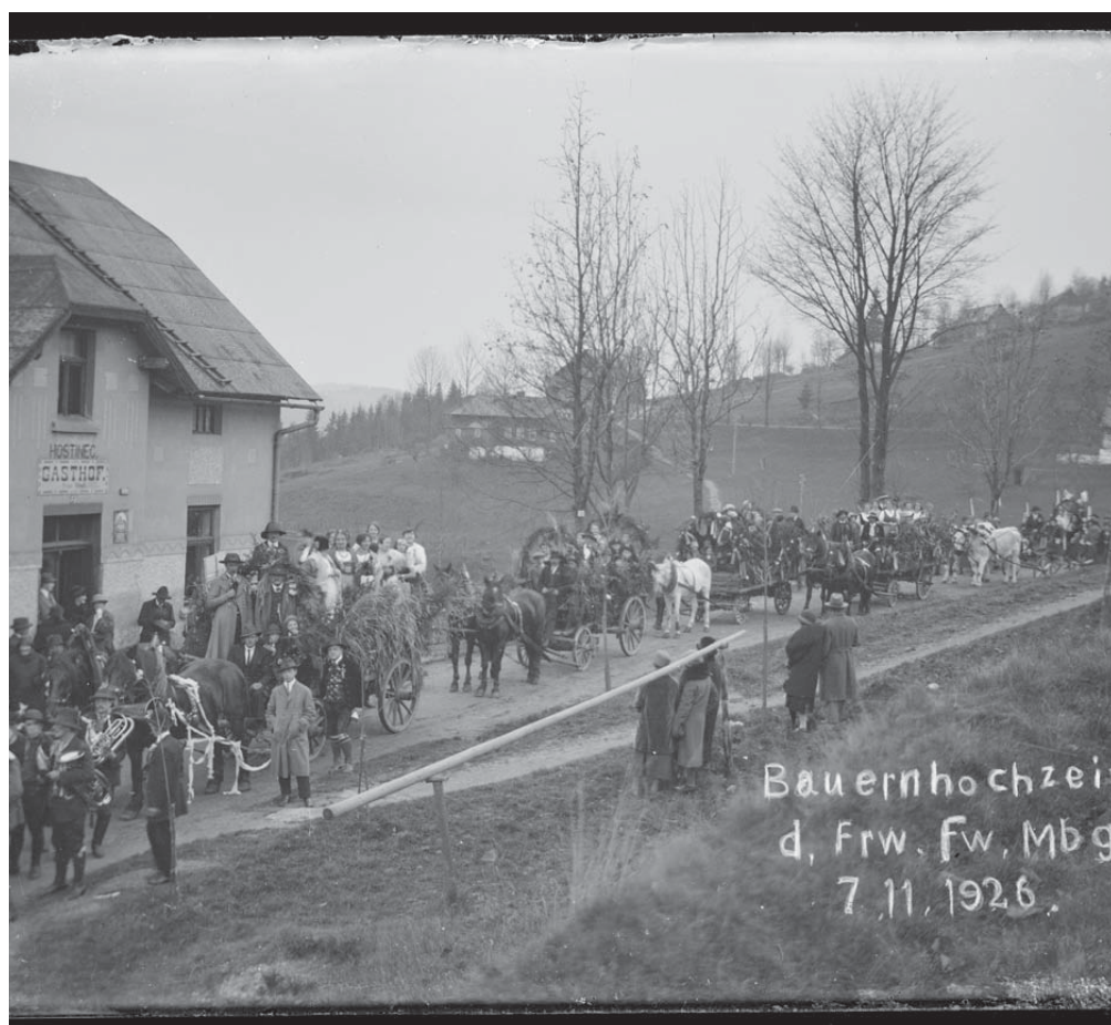
Selská svatba 7.11.1926.