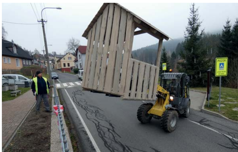
Vlastní instalace za pomoci těžké techniky (TS Albrechtice).