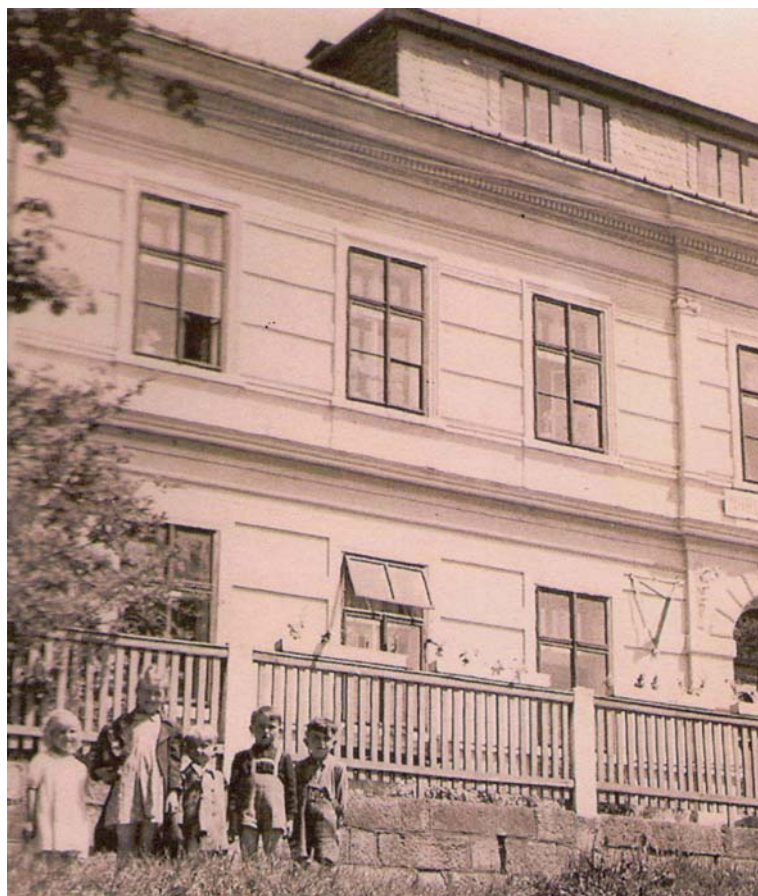
Konečná podoba školy. Foto po roce 1945.