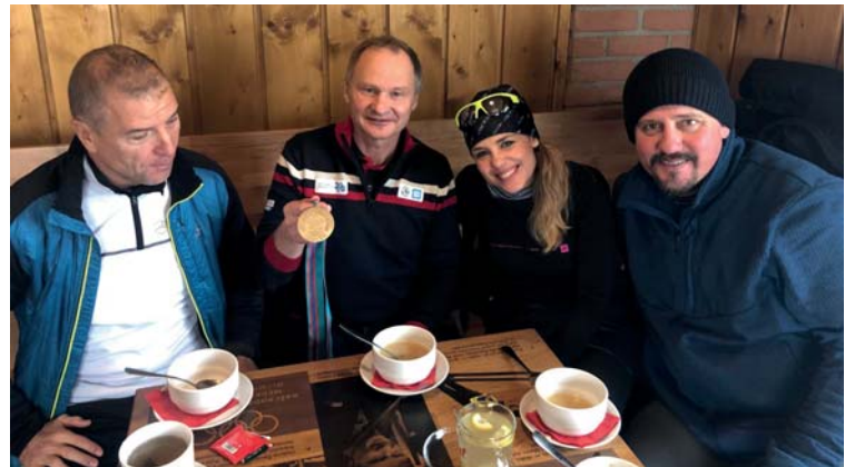
Rozhovor pro pořad Běžkotoulky v Abrechticích s Pavlem Bencem (uprostřed s olympijskou medailí), bronzovým medailistou ze ZOH 1988 v Calgary.