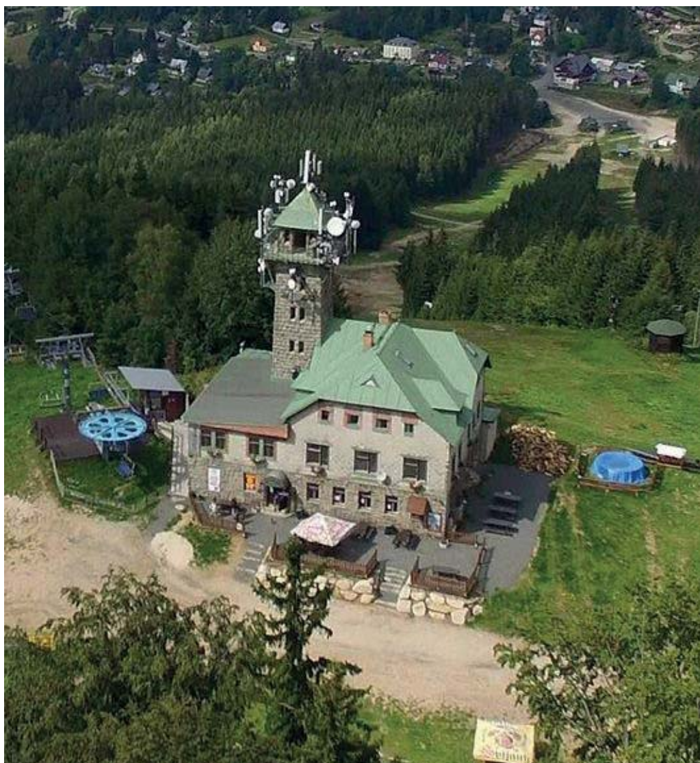
Rozhledna Špičák z roku 1909 by měla projít generální opravou.