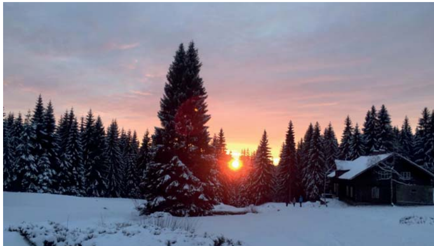
Západ slunce na Mariánskohorských boudách. Vánoce 2019.