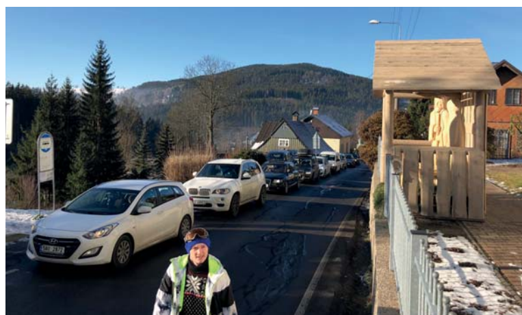
Pomalu popojíždějící fronta aut lyžařů, která dosahovala od parkoviště pod slalomákem až pod obchod Vlček. Jízda trvala zhruba tři čtvrtě hodiny! Naštěstí kolaps dopravy trval jen tři dny a potíže zmizely se spuštěním sedačkové lanovky u Krmelce.