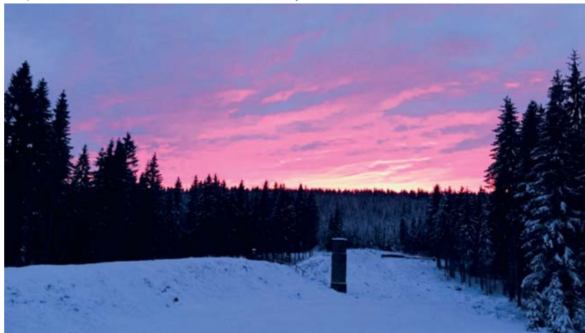
Podvečer na Protržené přehradě. Vánoce 2019.