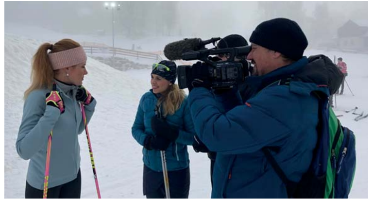
Nejúspěšnější biatlonistka v historii tohoto sportu Gabriela Koukalová při natáčení v Bedřichově. Pořad Běžkotoulky vysílá ČT2, ČT sport a slovenská STV 2.