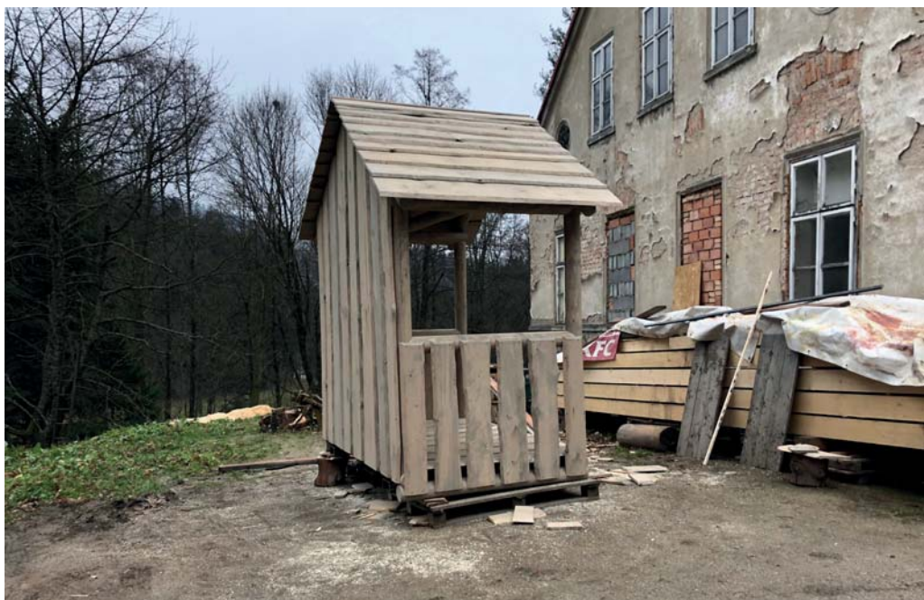
Výroba přístřešku v Jiřetíně 25.11.2019.