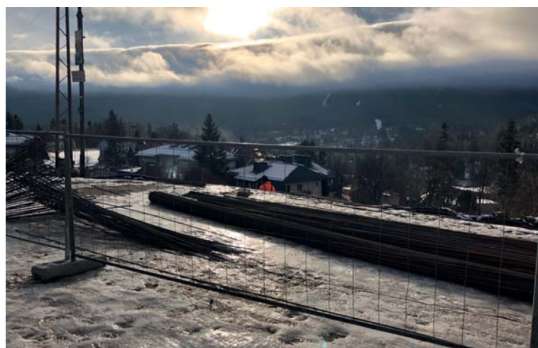
Příprava plochy pro výstavbu další rozhledny z našeho společného projektu v polské Sklářské Porebě.