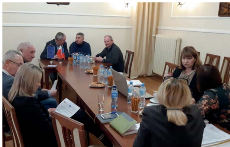
Zástupci Albrechtic, Ski Bižu Jablonec a Sklářské Poreby na jednání o společném projektu na výstavbu a opravu rozhleden v Polsku a České republice.