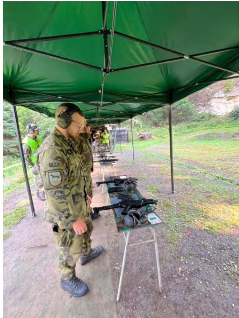
Na palební čáře voják Armády ČR. Zbraní, kterou se střílelo, byl samopal EVO scorpion z České zbrojovky Uherský Brod.