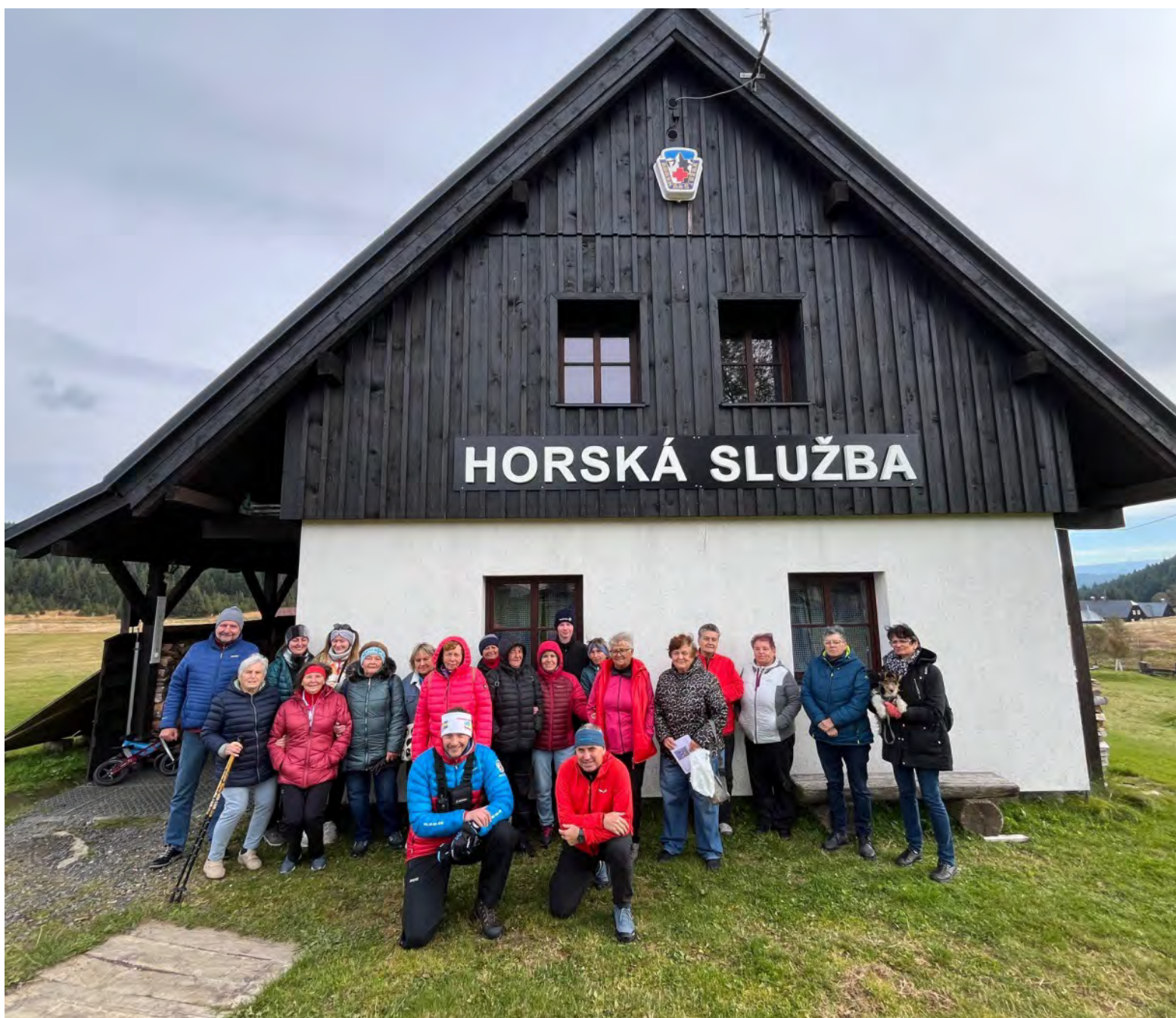
Služebna Horské služby na Jizerce.