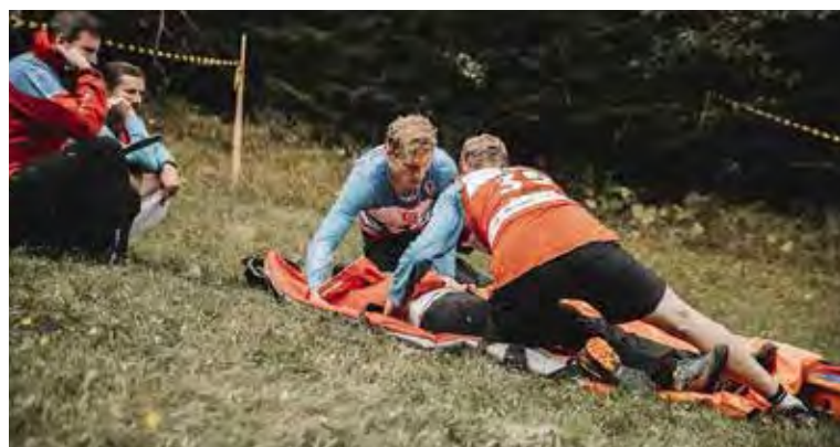
Jeden z úkolů – poskytnutí první pomoci zraněnému.