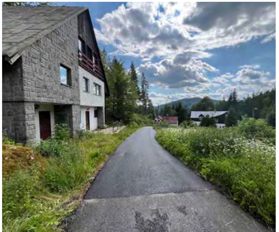
Nově opravená komunikace ve Waberlochu u bývalého penzionu Kámen. Náklady dosáhly cca 900 tis. Kč.