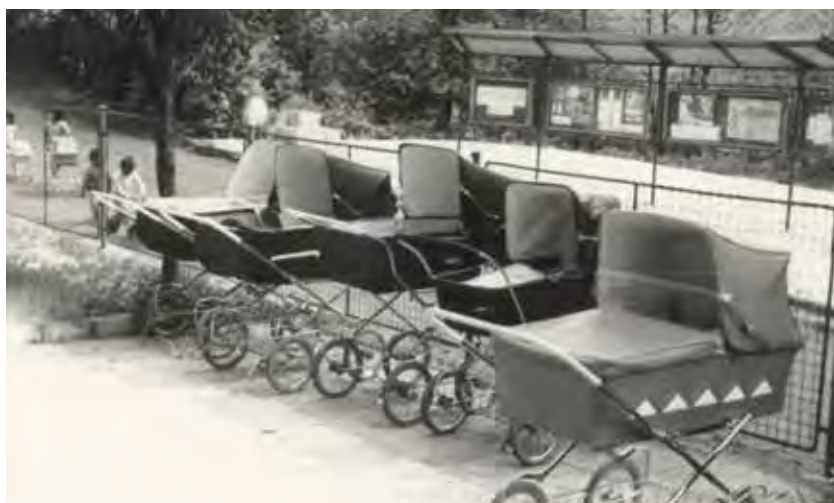
Kočárky před Místním národním výborem Albrechtice. Zřejmě vítání občánků, 80. léta 20. stol.