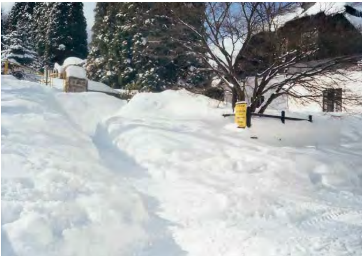
Cestička k faře.