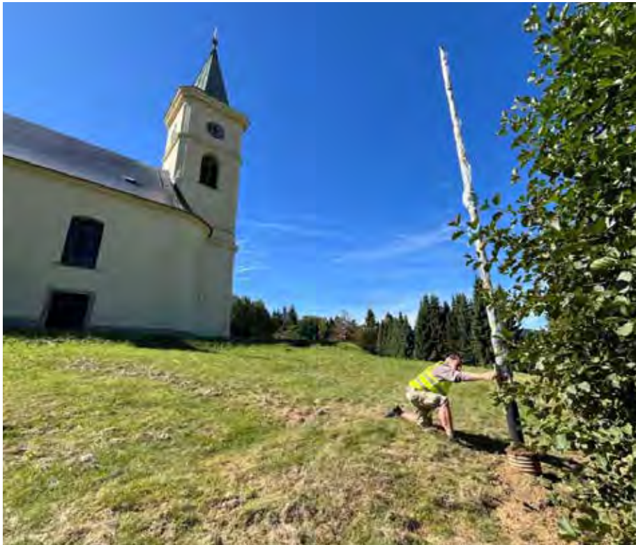
Z. Vodička instaluje nový stožár, kde je umístěn reflektor, který nasvěcuje kostel.

V srpnu finišovaly práce u školy. Po obnovení vnějších izolací a odvodnění školy přišly na řadu chodníčky, které usnadní žákům cestu na školní hřiště nebo obědy v mateřské škole. Náklady dosáhly necelých 500 tis. Kč.