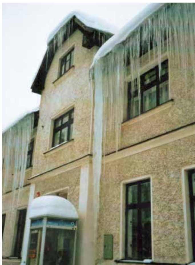
Velké zimy v Albrechticích – pošta s obrovskými ram-pouchy. Pošta v naší obci byla od roku 1889.