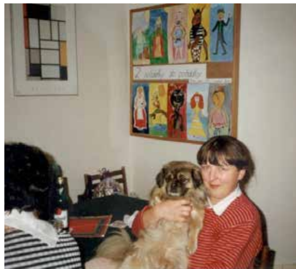
Kolektiv pracujících na poště se scházel i po práci.