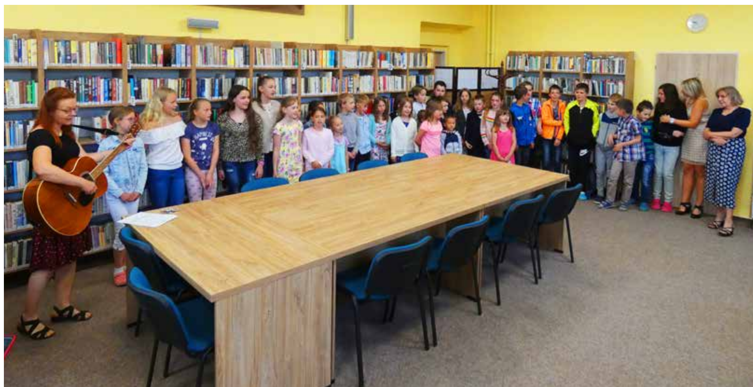
Rozloučení s paní ředitelkou.