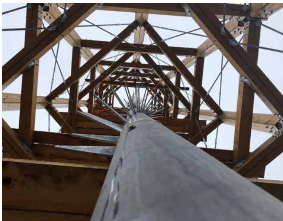
Průhled budovaným schodištěm rozhledny 3. srpna 2020.

Vysoutěžená cena rozhledny: 6 483 849,88 Kč Dotace z EU: 186 839,20 EUR Dotace z ČR: 10 990,54 EUR