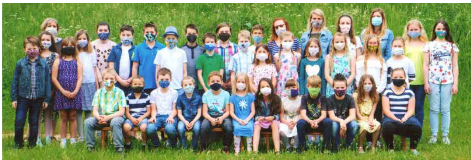
Základní škola Albrechtice v Jizerských horách 2019 – 2020.