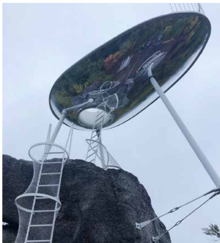
Zajímavé architektonické dílo putovalo na své místo 30. září. Vyhliídka stála zhruba 3,5 mil. Kč a Tanvald financoval výstavbu z vlastních zdrojů (bez dotací).