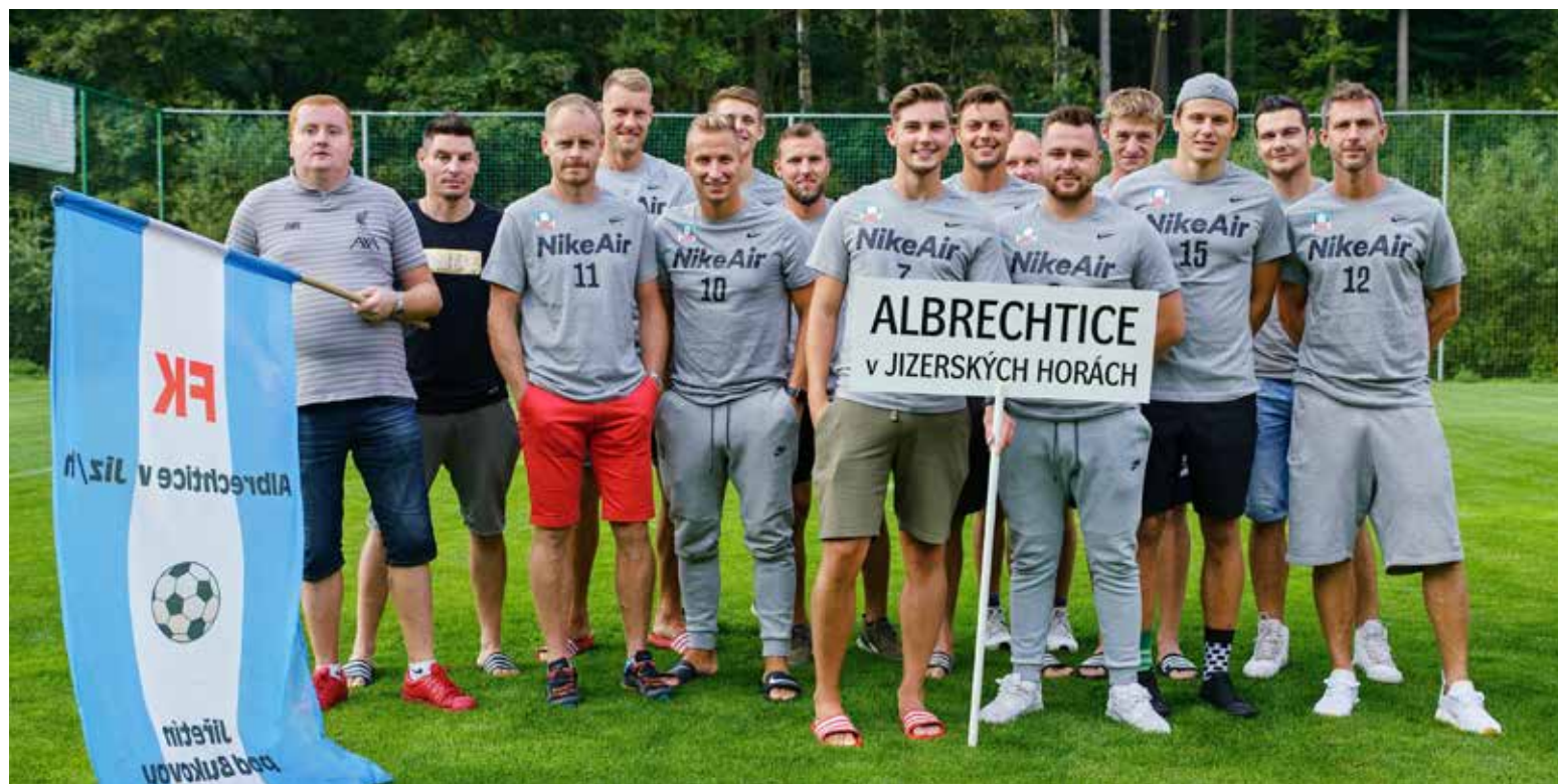
Místní mužstvo při slavnostním nástupu.