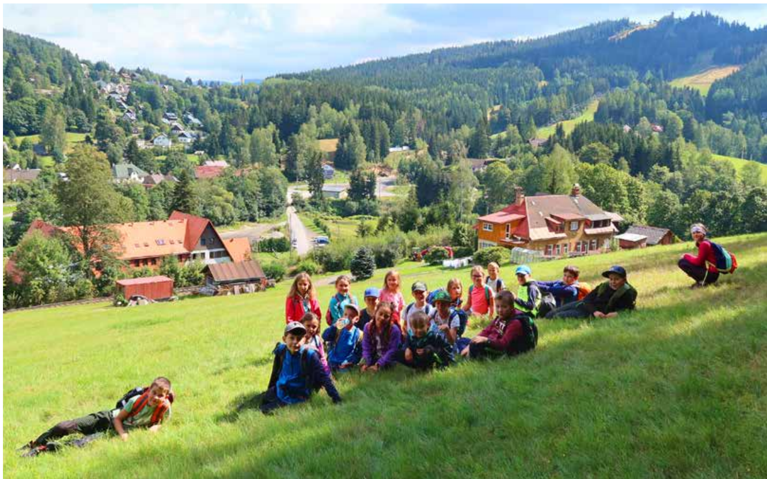
Odpočinek na louce.