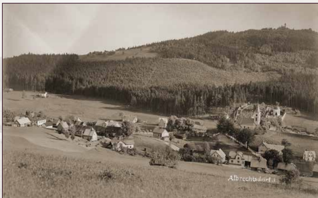
ALBRECHTICE V JIZERSKÝCH HORÁCH 2021