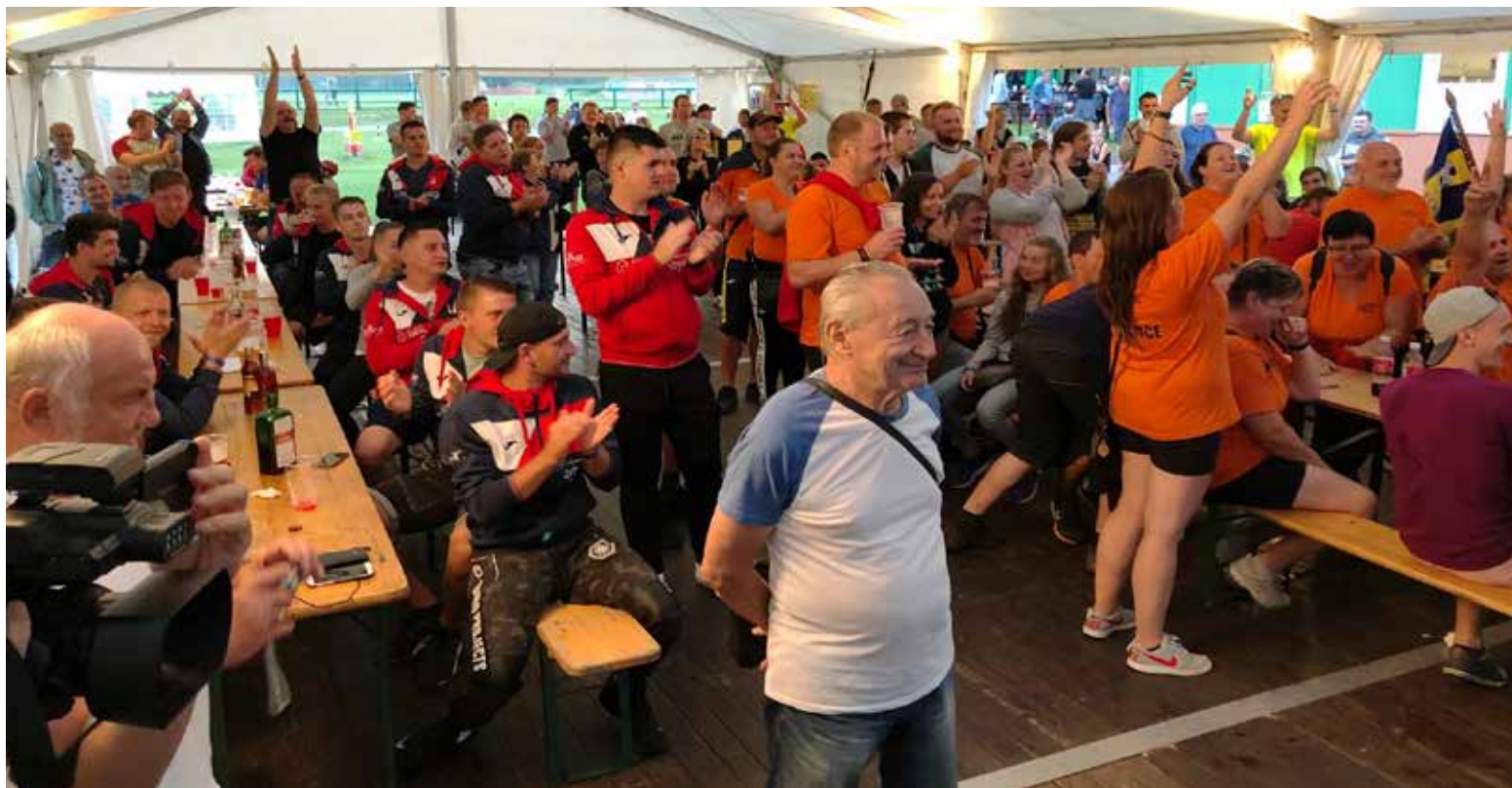
Velký stan v areálu U Kamenice byl při vyhlásování fotbalových výsledků zcela zaplněn.