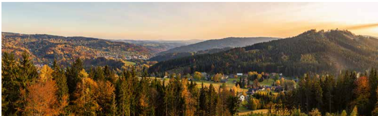
Podzimní panorama z vrcholu rozhledny.