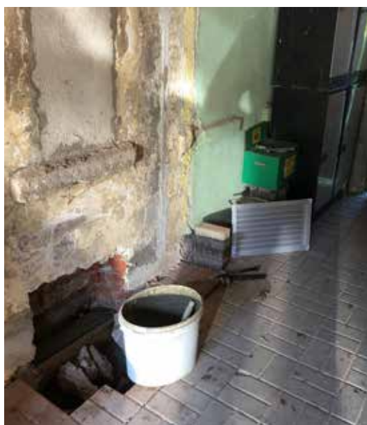
Dozdívání průrazů do sklepa ve škole.

Pánové Mašek a Kubelka v říjnu prováděli stavební úpravy ve sklepě základní školy. Za poslední 4 roky jsme investovali do mateřské a základní školy 8 700 000 Kč.