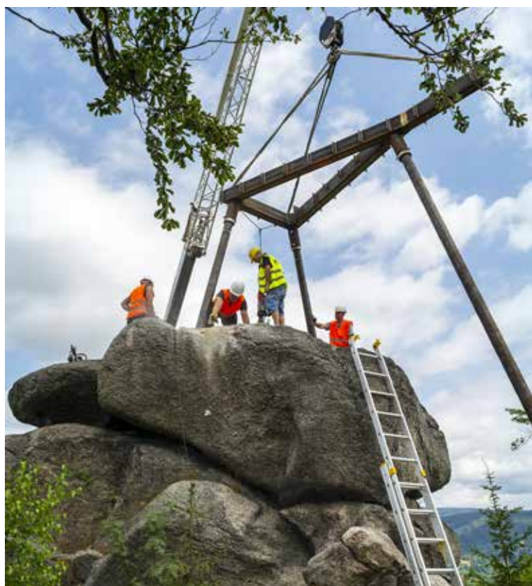
Malý Špičák v Tanvaldě – červenec 2020. Zkouška prototypu nové rozhledny. Model byl následně odvezen a vlastní montáž proběhla až o několik týdnů později.