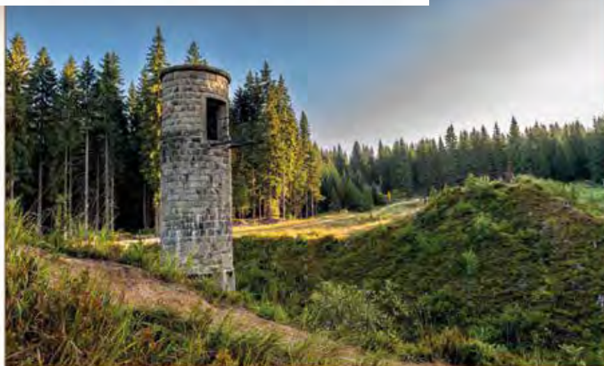
Areál Trostředné přehrady, léto 2023

LEDEN 1 2 3 4 5 6 7 8 9 10 11 12 13 14 15 16 17 18 19 20 21 22 23 24 25 26 27 28 29 30 31