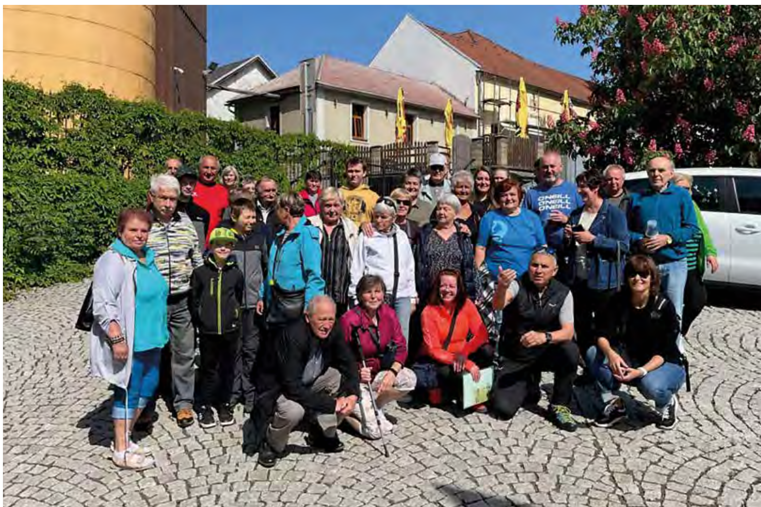
Společná fotografie účastníků zájezdu před pivovarem Svijany.