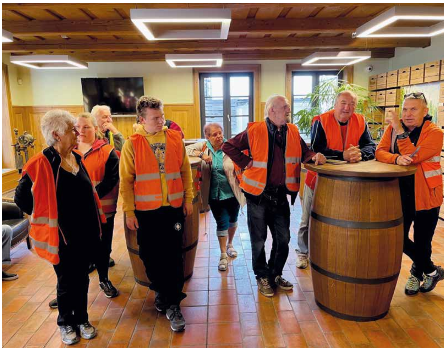
Vstupní hala do pivovaru.