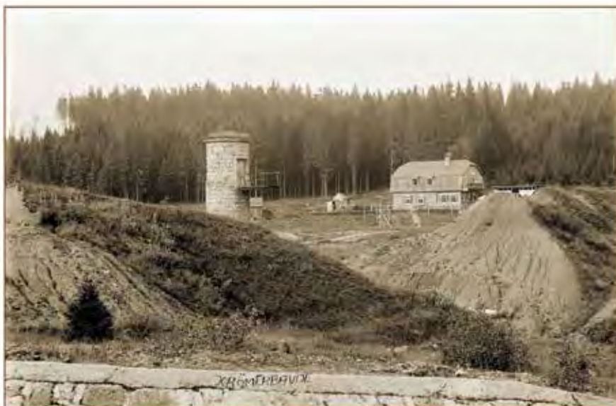
Krčmet Bauda na Trostředné přehradě před rokem 1930

V OBOUSTRANNÉM PROVEDENÍ (historická fotografie / soudobá fotografie) jsou k zakoupení na obecním úřadě.