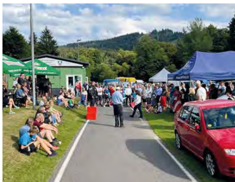
Přes 400 fanoušků automobilových veteránů se sešlo po 17. hodině v našem sportovním areálu na vyhlásování vítězů.