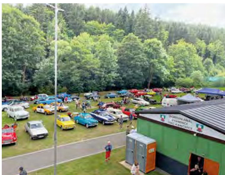
Zaplňený areál u Kamenice. Na tradiční setkání přijelo 137 historických aut.