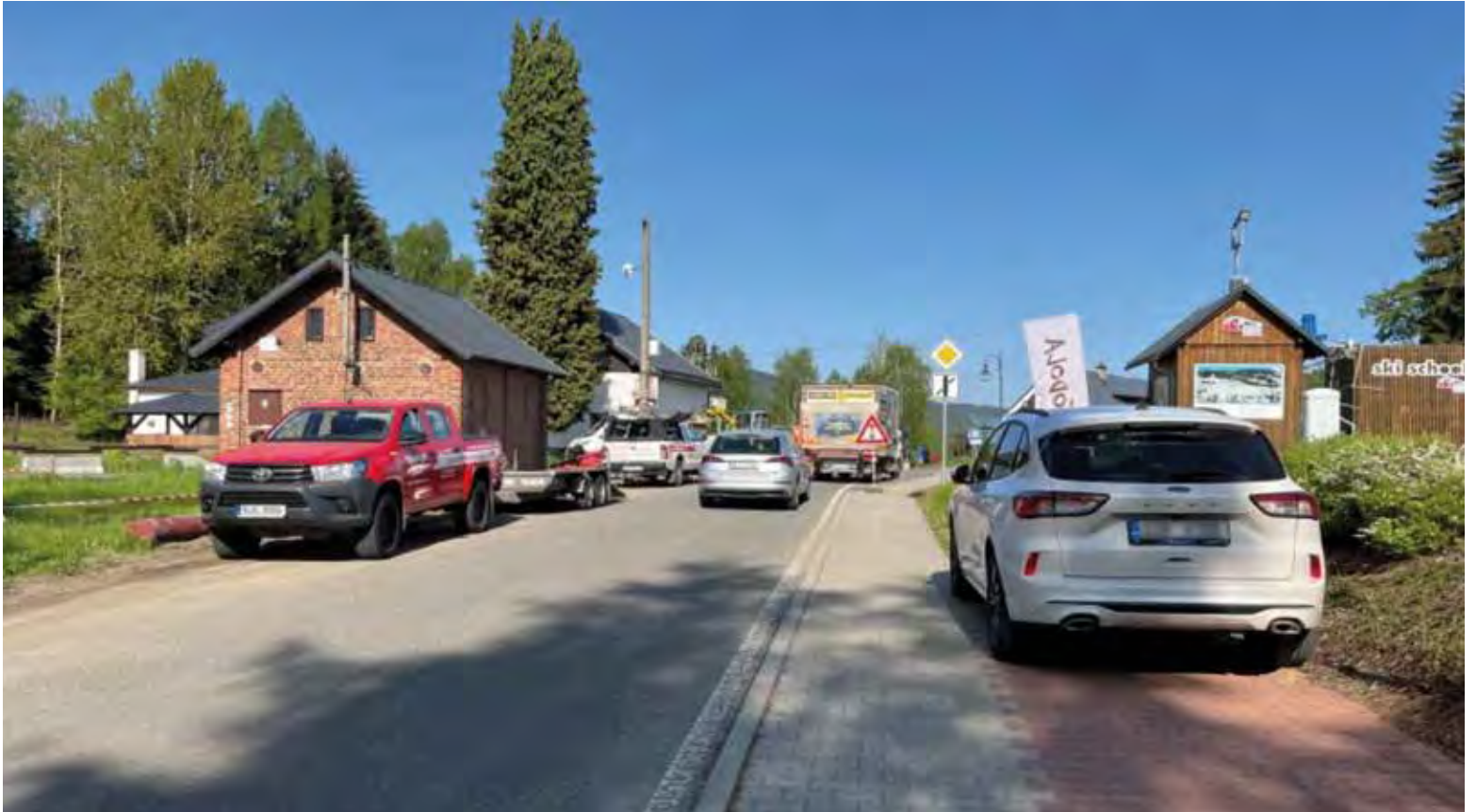
Dopravní situace 25.5.2023 – doprava v sedle Jizerky byla regulována semaforů.

Výkopové práce firmy Eliprom z Liberce, která vyhrála zakázku pro ČEZ, začaly v květnu. Zátěž byla pro obec značná, jak finanční, tak organizační. Neobešlo se to bez uzavírek, semaforů, odstávek elektřiny, hlídání prací firm, aby nezasahovaly do cizích pozemků, ale také jednání s vedením ČEZ a firmou Eliprom.