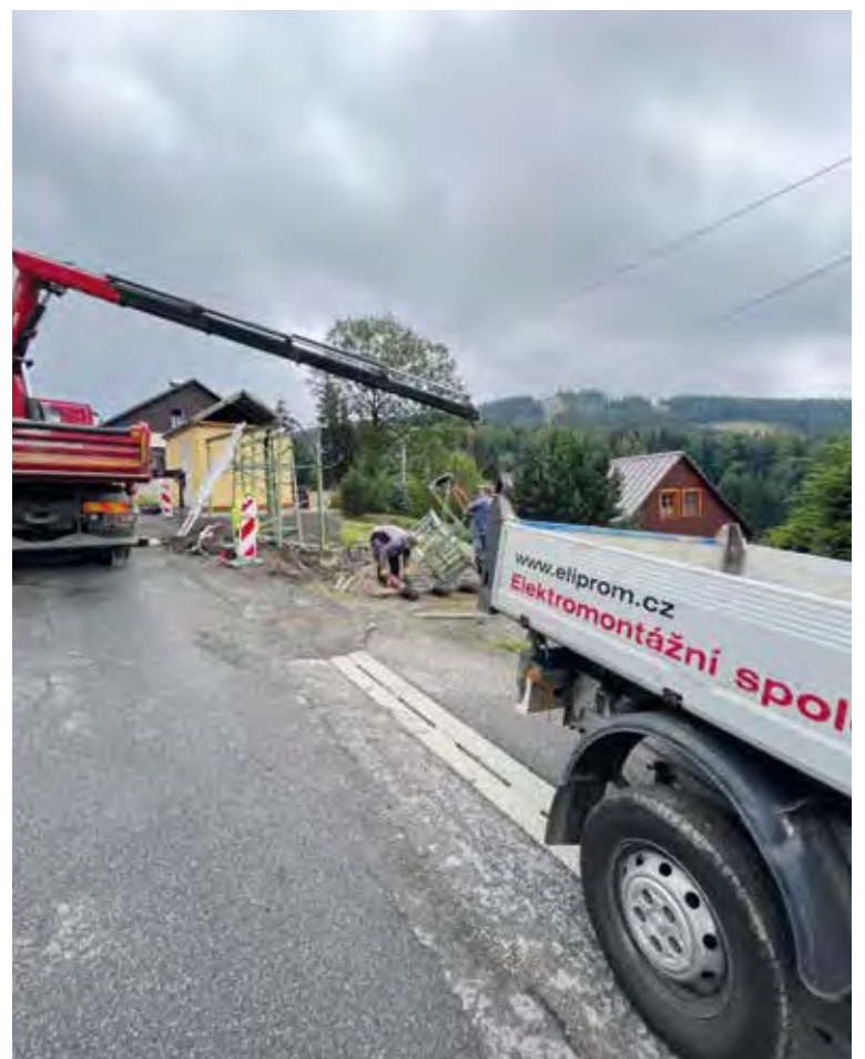
Likvidace staré nadzemní trafostanice (srpen 2023).

Srpnové počasí bylo velice deštivé a chladné a ztěžovalo práci zaměstnancům firmy Eliprom, která celou akci prováděla. Foto je ze 7. srpna, plachty a stany jen částečně chránily pracovníky před deštěm.