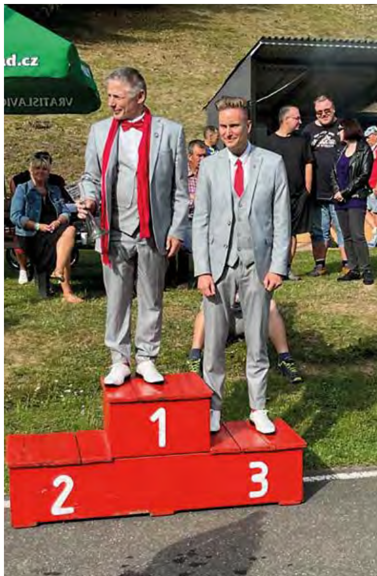
Pražská posádka vyhrála se svým Mercedesem soutěž „elegance“.