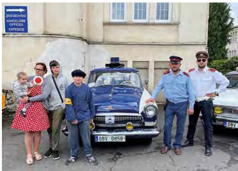
Zastoupení měly i Albrechtice. Policejní Volha Holešínských patří k ozdobám každého srazu veteránů.

Jubilejní 10. ročník rallye soutěže Veteránem za Krtečkem do Jizerských hor se konal 22. července. Účast 137 aut byla rekordní včetně počtu účastníků, kterých bylo 330! Nejvzdálenější posádka byla až z Trnavy na Slovensku (což je 450 km). Zajímavá posádka byla také z Brna, která po cestě k nám, na 10. ročník soutěže, projela 10 zemí (Česko, Polsko, Slovensko, Maďarsko, Srbsko, Chorvatsko, Slovinsko, Itálii, Rakousko a Německo) a ujela téměř 5 000 km! V cíli rallye v našem sportovním areálu u Kamenice se sešlo 400 účastníků a fanoušků starých aut. Celý den vládlo příjemné letní počasí a účastníci se rozjížděli do svých domovů až po 18. hodině.