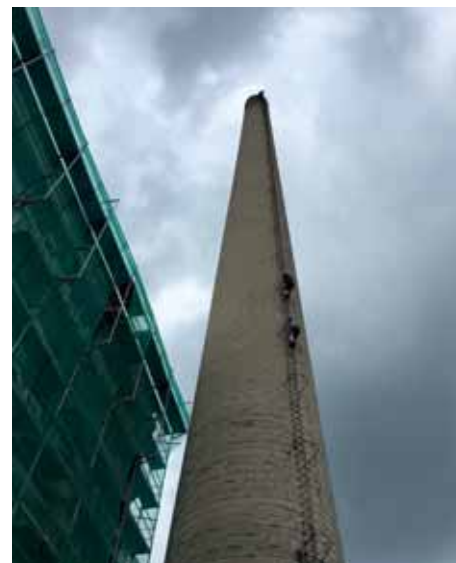
Tovární komín DETTOA