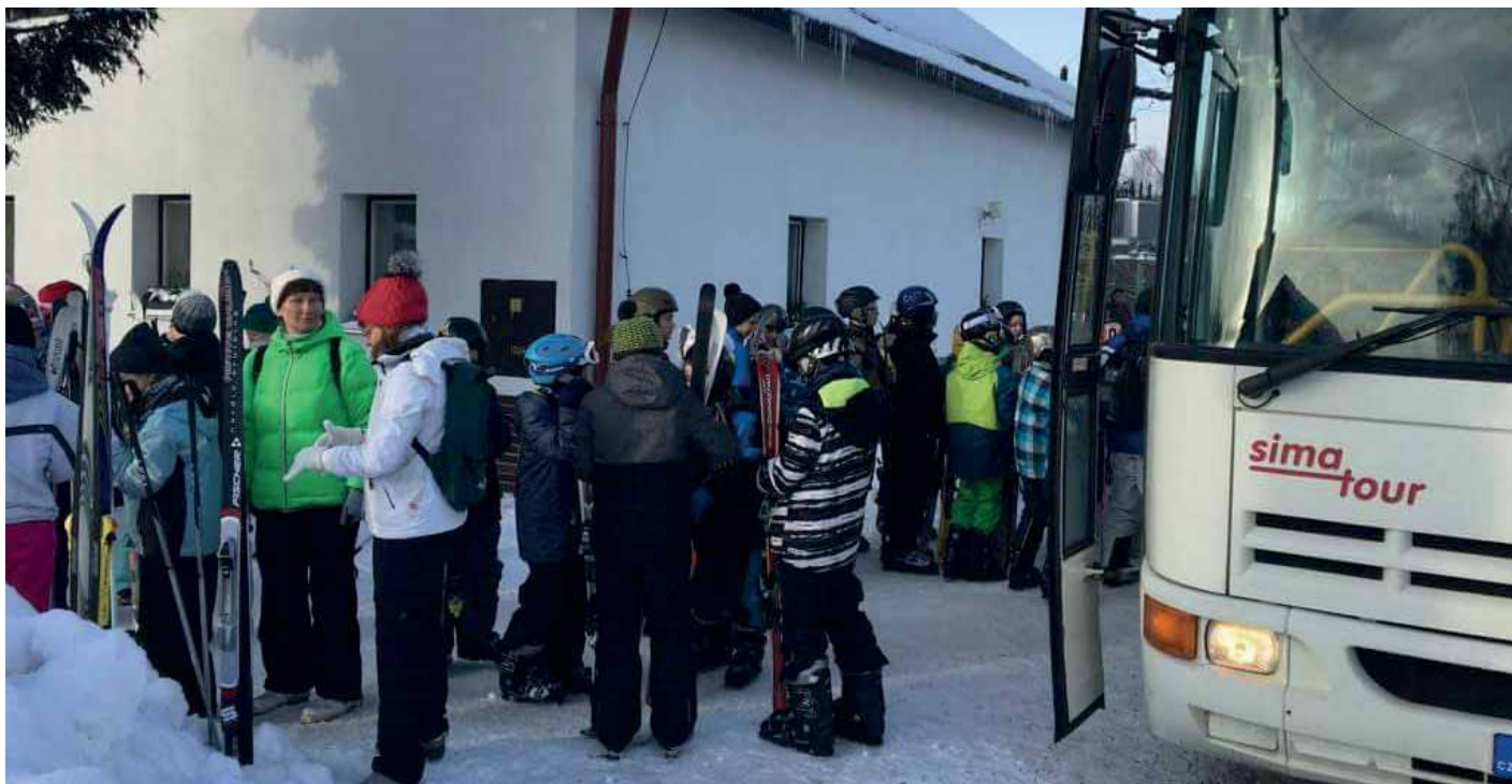
Lyžařský kurz vystupuje na zastávce u Jizerky.

Běžkařské okruhy v obci byly využívány nejen našimi občany, ale i účastníky lyžařských výcviků.