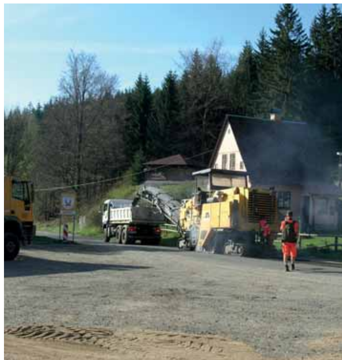
Frézování starého asfaltu ve směru na Žďár.