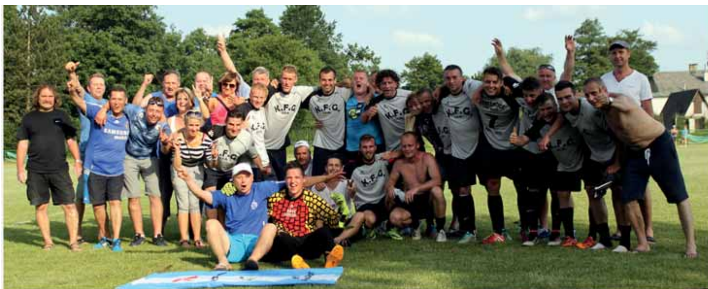
Historicky první vítězství v turnaji Štít Albrechtic v roce 2016