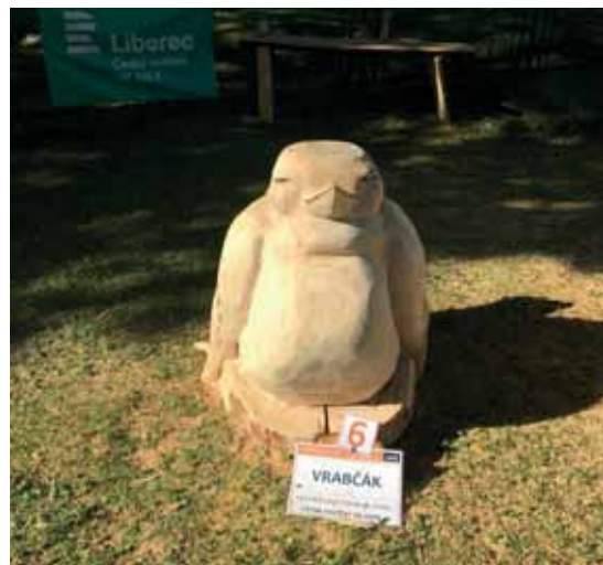
Vrabčák našel svůj nový domov na Mariánské Hoře u Vejražky