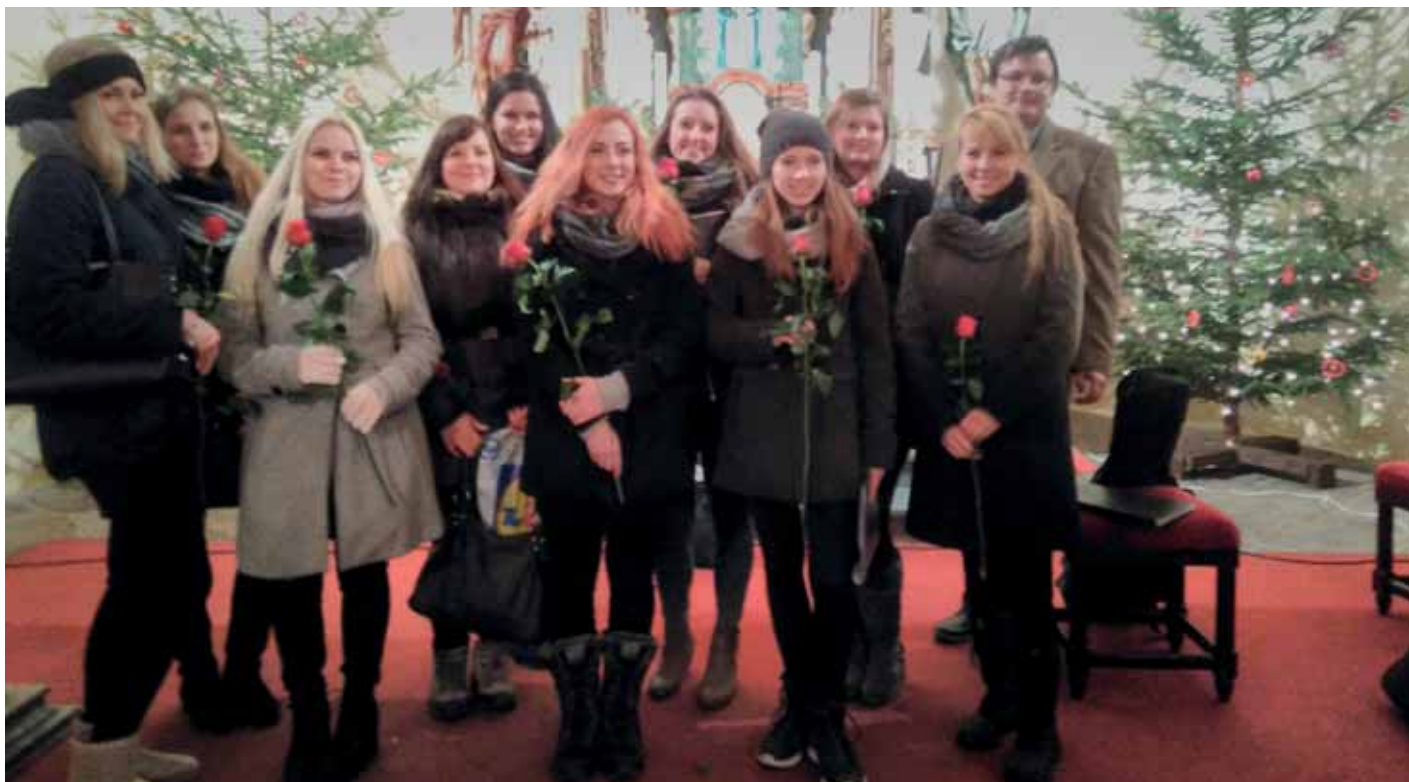
Závěrečné loučení vystupujících.