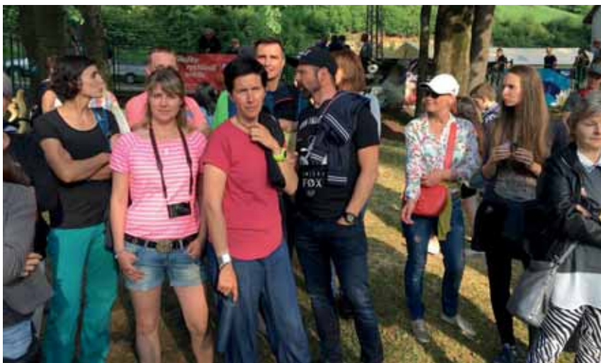
Skupinka Albrechticáků na dražbě výtvorů z „Desenského dřevosochání“

Ani na letošním 9. ročníku dražby dřevěných soch, které vznikají v průběhu Symposia Desná, nechyběli dražitelé z Albrechtic. Ti svými nejvyššími nabídkami u několika uměleckých děl přispěli k celkovému výtěžku dražby více než 50 tisíc. Celkový výtěžek letos přesáhl 170 tisíc.