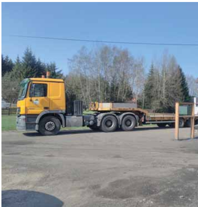
Technika firmy STRABAG u Jizerky.

Po 40 letech jsme se dočkali opravy části krajské komunikace od pomníku do Žďáru. Dlouhé 4 roky trvalo úsilí vedení obce o rekonstrukci silnic vedoucích do obce. V loňském roce byla opravena silnice kolem Kamenice k poště, v letošním roce přišel na řadu i úsek vedoucí naší obcí do Žďáru.