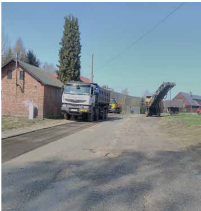
Frézování vozovky u Jizerky.