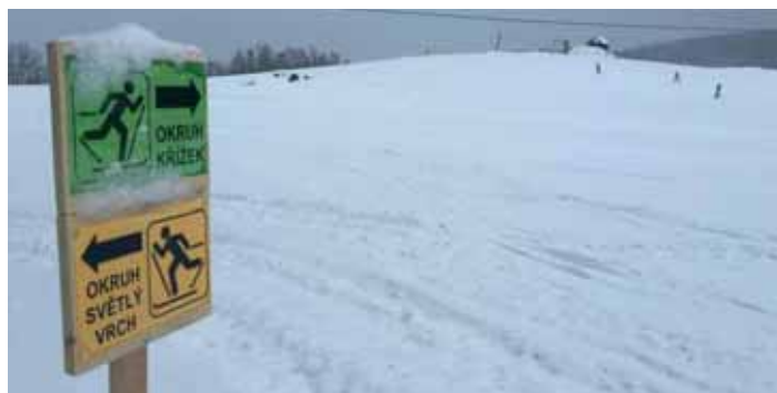
Tratě pro začínající běžkaře v areálu nad Křížkem a na Světlém vrchu měří přibližně 3,5 km