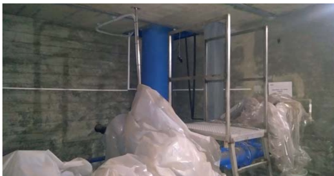
Interiér vodojemu bez vody - v čase rekonstrukce

Na střeše vodojemu na Křížku vzniká nové vyhlídkové místo, kde bude umístěna panoramatická mapa s popisem horských vrcholů a naučné cedule o "výrobě" vody.