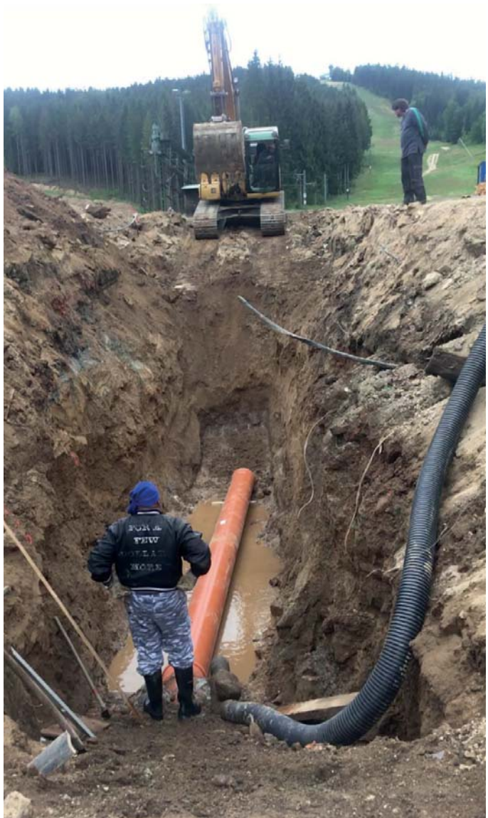
Výměna části potrubí kanalizační stoky na parkovišti Špičák II