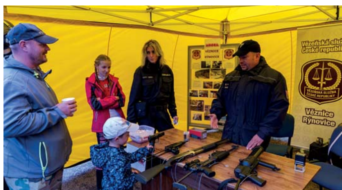
Stánek vězeňské služby Rýnovice