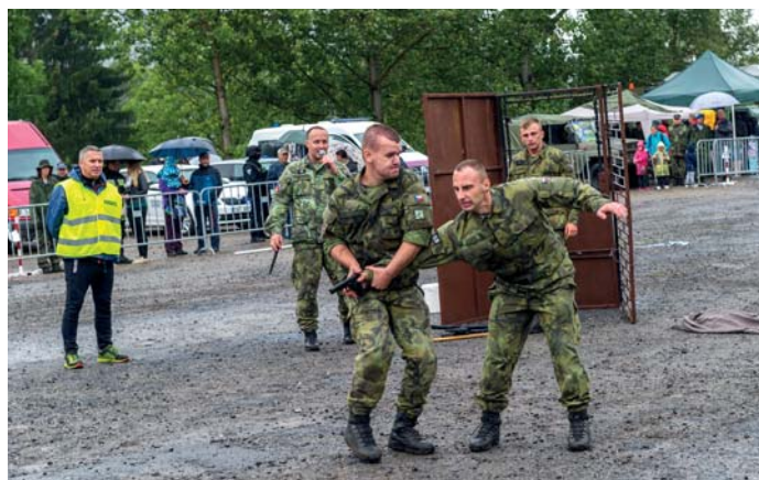
Armáda ČR – ukáзка boje na blízko