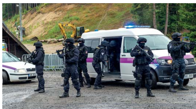
Eskort nebezpečného vězně, dynamická ukáзка vězeňské služby Rýnovice