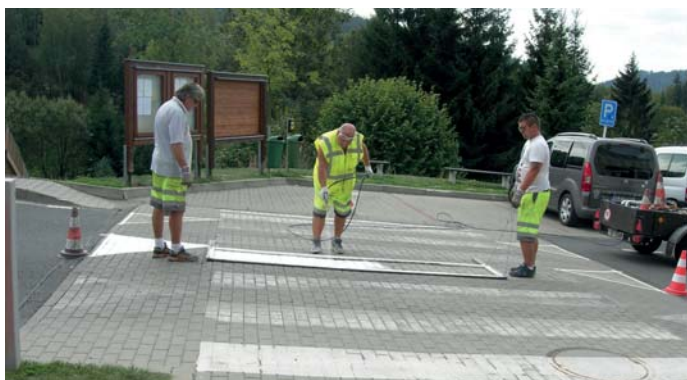
Nový nástřik přechodu pro chodce u základní školy