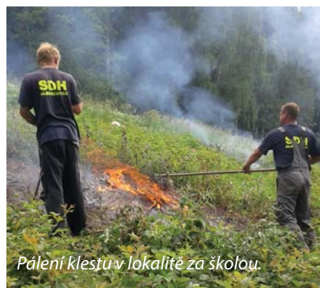
Pálení klestu v lokalitě za školou.

V měsíci květnu proběhla pravidelná školení členů jednotky a soutěž v požárním útoku O Jizerský pohár v Des-