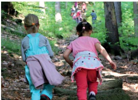
Brigáda Mariánskohorské schody

Děkujeme všem malým i velkým brigádníkům!