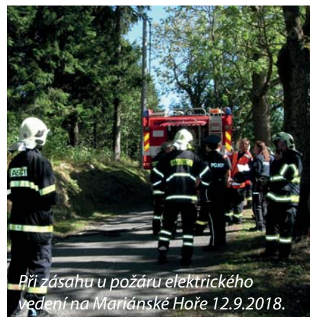
Při zásahu u požáru elektrického vedení na Mariánské Hoře 12.9.2018.

Dne 1. června krátce před šestou hodinou večerní byla jednotka Albrechtice povolána Operačním střediskem krajských hasičů k údajnému požáru lesního porostu v blízkosti železniční stanice Antonínov. Jednotka hasičů naší obce vyjela na místo události do Antonínova, kde provedla průzkum úseku koryta řeky Kamenice a nezbytnou přípravu pro případné čerpaní vody. Dalším přibližně půlhodinovým