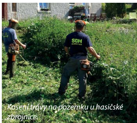
Kosení trávy na pozemku u hasičské zbrojnice.

V měsíci květnu proběhla pravidelná školení členů jednotky a soutěž v požárním útoku O Jizerský pohár v Des-