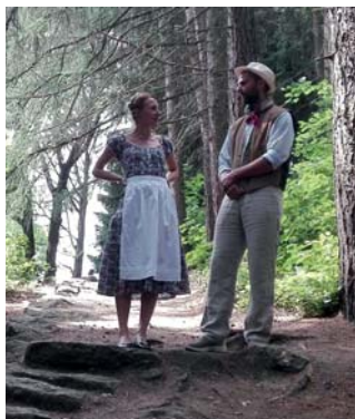
Prezentace Vesnice roku

Velice nás těší, že i díky činnosti našeho spolku letos naše obec Albrechtice v Jizerských horách získala ocenění v soutěži Vesnice roku – bílou stuhu. Pro naši obec ocenění znamená kromě prestiže i finanční odměnu ve výši 600 tis. Kč.