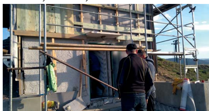
Průběh a výsledek opravy exteriéru vodojemu