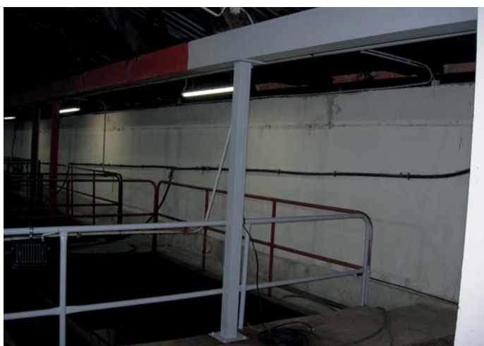
Nátěr kovových konstrukcí a zábradlí v ČOV

Obec každoročně na opravy a provoz kanalizace a čistírny vynakládá nemalé prostředky. V letošním roce se náklady na nutné opravy, údržbu a provoz vyšplhaly ke 2,5 mil. Kč.