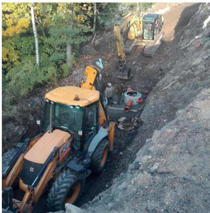
Šachta na parkovišti Špičák II před opravou a po opravě