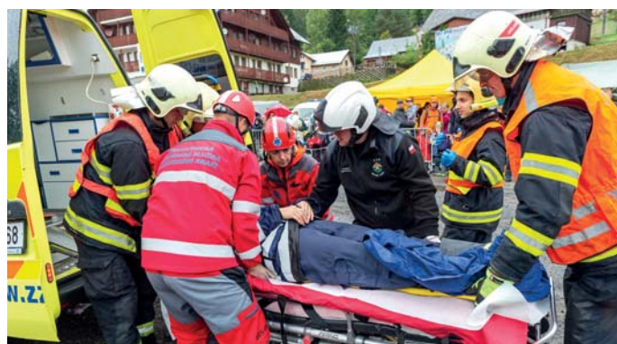
Společná ukáзка zásahu hasičů a záchranářů při dopravní nehodě