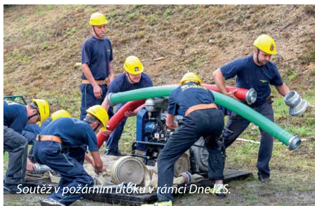
Soutěž v požárním útoku v rámci Dne IZS.

pušky. Na konci srpna již podruhé v tomto roce provedli hasiči brigádnicky posekání trávy v okolí bytového domu č.p. 24. Dne 1.zář se naše soutěžní družstvo za vytrvalého deště zúčastnilo domácí soutěže O Zlatou proudnici, která proběhla v rámci Dne IZS v Albrechticích. Soutěžní družstvo čekají v letošní sezóně ještě dvě soutěže, Tanvaldský pohár a Memorál BK na Smržovce. Na měsíc září mají albrechtičtí hasiči naplánovanou návštěvu Mateřské školy, kde společně s psovodem Městské policie předvedou dětem své dovednosti a techniku. V měsíci říjnu pak hasiči provedou každoroční přípravu našeho zásahového vozidla DA 8 Avia na technickou kontrolu