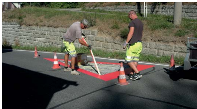
Pravidelné obnovování značení přispívá ke zvýšení bezpečnosti dopravy