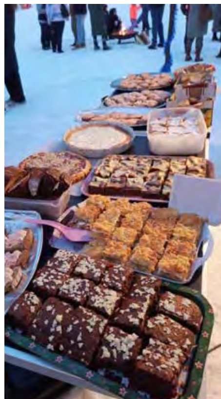
Albrechtická školka a škola, ředitelka A. Janušková