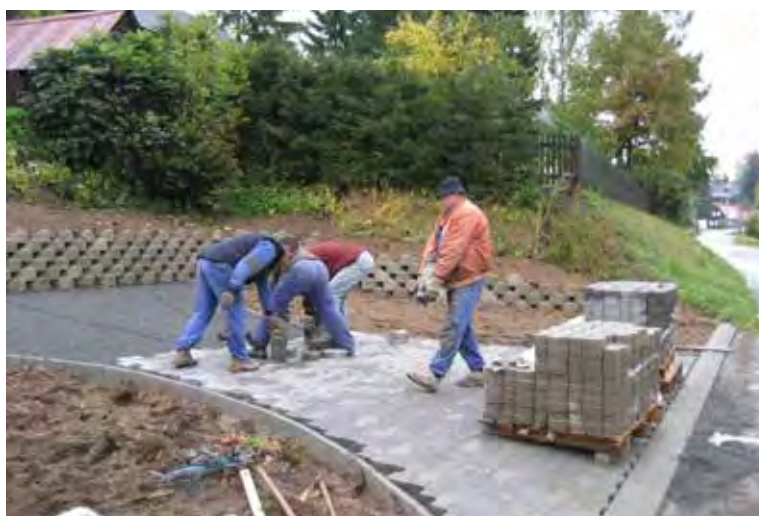
Parková úprava naproti restauraci „Jako doma“. Rok 2008.

Prostor u našeho hřiště byl vybrán jako zásobárna sněhu na MS Liberec v roce 2009. Od prosince 2008 do ledna 2009 bylo vyrobeno sněžnými děly za použití chladicí věže několik tisíc m 3 sněhu. Výška „sněhového kopce“ dosahovala 17 m a převyšovala i silnici do Josefova Dolu. Sníh nám vydržel až do začátku června!