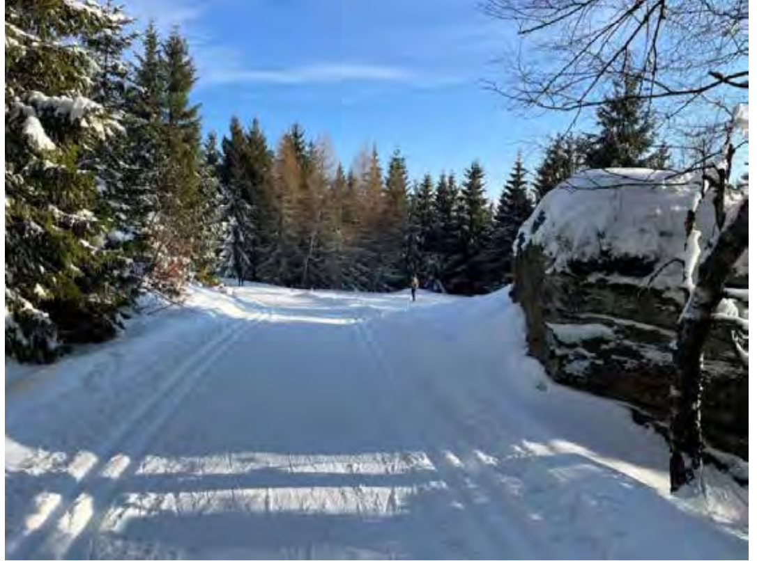
Tratě v Jizerských horách jsou kvalitně udržované celou zimu