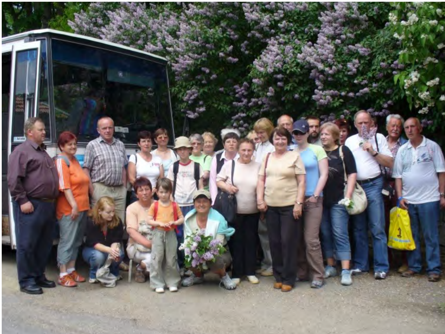
Výlet občanů do Mnichova Hradiště, 17. května 2008.