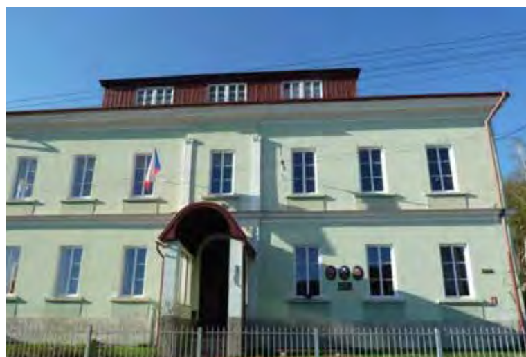
Pohled na školu a Obecní úřad v roce 2012.