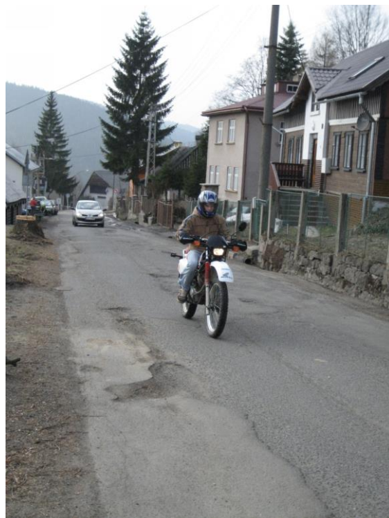
Jedna z mnoha děr u školy.