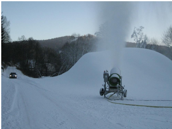
29.12.2008 – sněžná děla v plném provozu.

V zimě 2008/09 se atrakcí naší obce staly dva obří kopce sněhu u fotbalového hřiště. Tento prostor sloužil jako deponie sněhu pro MS 2009 v Liberci v klasickém lyžování. Velké mrazy na přelomu roku umožnily v krátkém období nastříkat zhruba 17.000 m 3 umělého sněhu. Velikost sněhových „hor“ dosahovala 12 metrů! Obec za tuto spolupráci s organizátory mistrovství světa obdržela finanční částku, volné vstupenky pro žáky z místní školy a také nový asfaltový povrch cesty u hřiště, který může v letních měsících naše mládež využívat např. k bruslení na kolečkových bruslích. Finanční obnos obdržel také náš fotbalový oddíl za pronájem kabin.