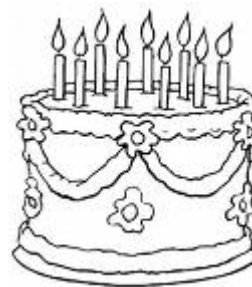
Olga Chlumová 85 let – únor 2009