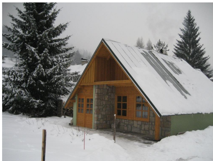
Leden 2009 – exteriér cukrárny.