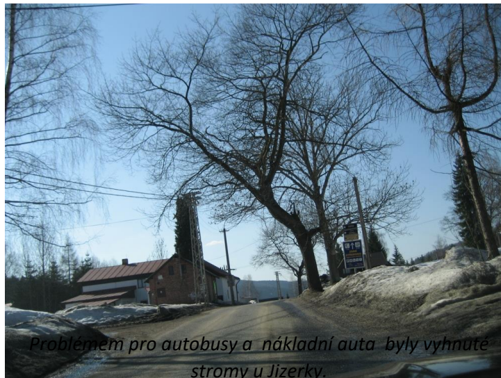
Zdeformovaný a vyhnílý strom u mostu pod Scharfovými.

V rámci zajištění bezpečnosti obyvatel a návštěvníků byly odstraněny některé stromy v těsné blízkosti silnice. Stromy byly pokáceny podle zpracovaného dendrologického posudku z roku 2008.(chtěli jsme se vyhnout tragédii ze čtvrtka 22.1. ve Zlíně, kdy na pohled zdravý strom spadl a usmrtil 2 školáky a zranil několik dalších lidí).