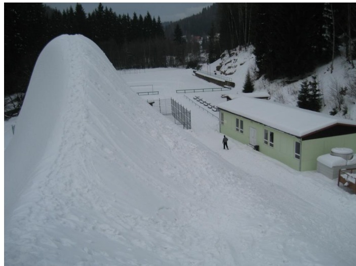
15.1.2009 – sníh je vyroben. Kopec dosahuje výšky 12 m!!!