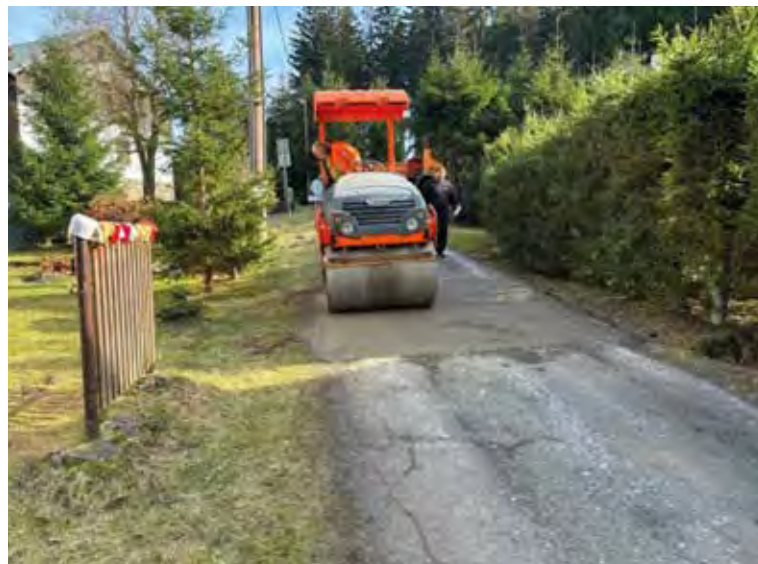
Oprava propadlého propustku na začátku Waberlochu (od Mariánské Hory). Březen 2024.